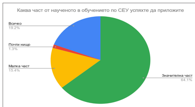
Фиг 2. Каква част от наученото в обучението по СЕУ успяхте да приложите?