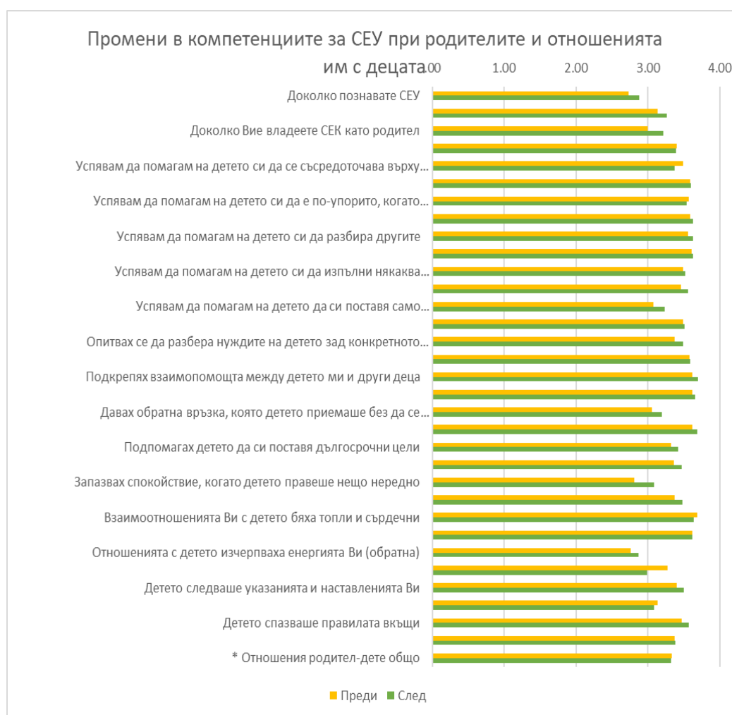
Фиг 3. Промени в компетенциите за СЕУ при родителите и отношенията им с децата