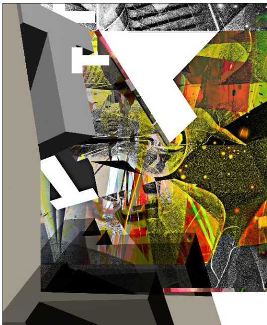
Post Scriptum / P.S 5