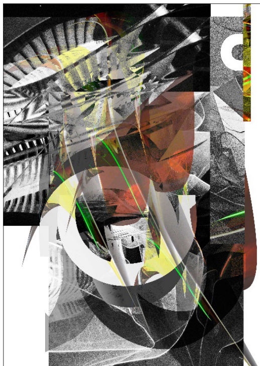
Post Scriptum / P.S 1

Към реализацията на серията „Post Scriptum / P.S – отвъд написаното“ Регина Далкалъчева подхожда оригинално, като съчетава традиционни и дигитални изразни средства. За основа при работата ѝ служи вече съществуваща авторска серия графични рисунки с абстрактна експресивна образност, реализирана чрез смесена техника, включваща молив, графитен прах, черна темпера и обемна структурна паста. Визуалното съдържание на тези рисунки е трансформирано с помощта на дигитален софтуер. Първоначалните рисунки са деконструирани, доведени до детайли, текстури, експресивни петна, мазки и линейни структури, които впоследствие са използвани за изграждането на дигитално генерирани образи 9 .