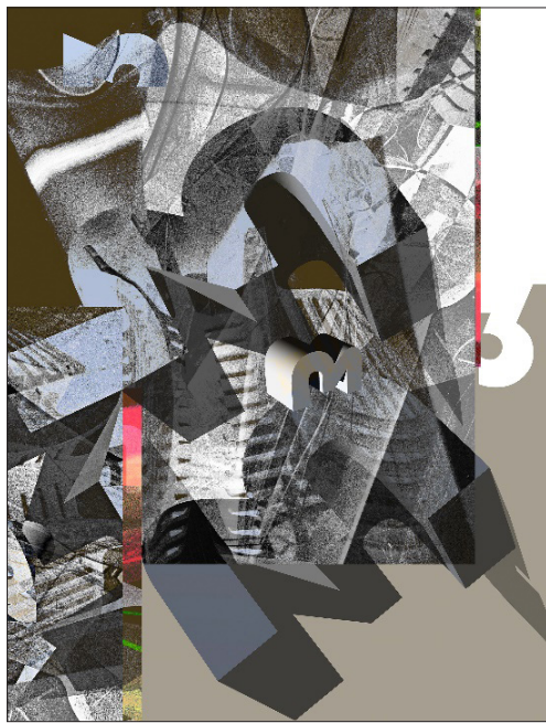
Post Scriptum / P.S 6

Арт книгите варират по форма и цвят и съчетават възможностите на съвременните технически достижения с ръчната изработка – дигитално проектирани и отпечатани, те са изцяло ръчно книговезвани, ръчно рязани, биговани, сгъвани и щанцовани. Осъществени са в лимитиран авторски тираж, като всеки екземпляр е ръчно номериран, датиран и сигниран.