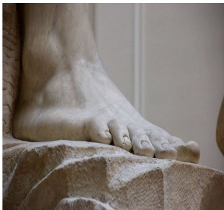
Фигура 3: Стъпалото на Давид