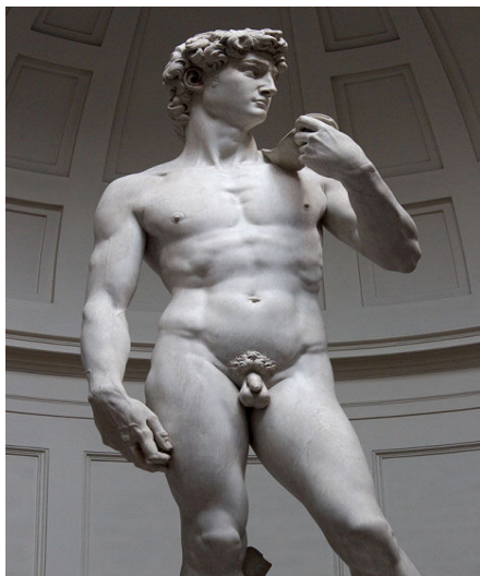
Фигура 1: Статуята Давид