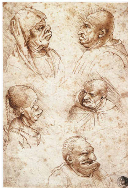
Фигура 6: Гротескни лица – молив и кафяво мастило