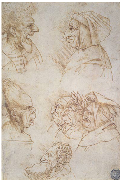
Фигура 5: Карикатури, около 16. век, молив и кафяво мастило, 202 x 150 мм.

На Фигура 5 са представени седем гротескни лица на: стара жена; старец с шапка; старец с дълга брада; стара жена, която вика и няколко фигури с различни носове. Фигура 6 също е илюстрация на пет гротескни лица от Леонардо, докато на фигура 7 са представени пет характера. Изследванията на тези пет характера са най-завладяващите и нелеки от рисунките, които са станали известни като „карикатурите“ на Леонардо. Той редовно рисувал гротескни или необичайни лица и тези изследвания са едни от най-популярните и влиятелни негови творби от 16. век до времето на Хогарт. Но за съвременните очи те не са толкова смешни, колкото странни и се свързват с адските видения на Бош и Брьогел.