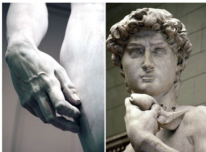
Фигура 2: Детайли от Давид