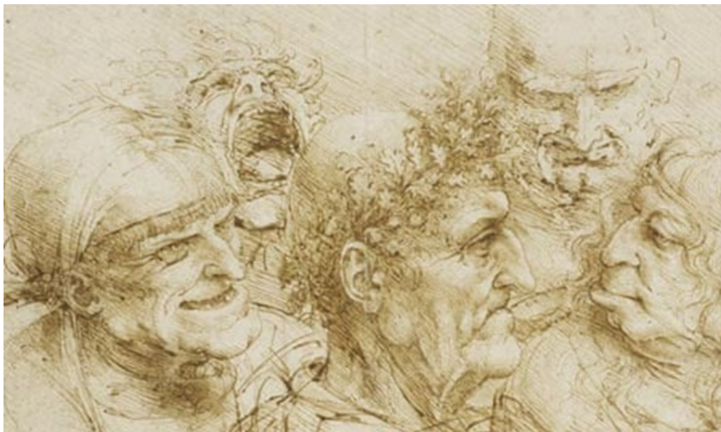
Фигура 7: Пет характера от Леонардо да Винчи.