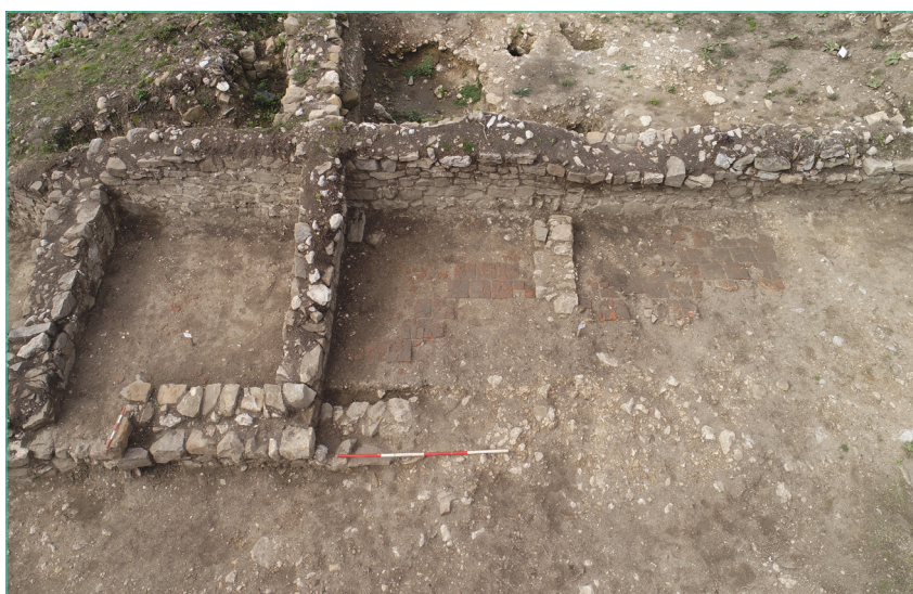
Обр. 4. Постройка в южната част на западното крило на затворения ансамбъл при Църква № 4 на Трапезица