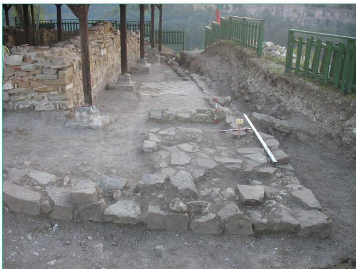
Обр. 7. Южна галерия на Църква № 4 на Трапезица. Изглед от запад.