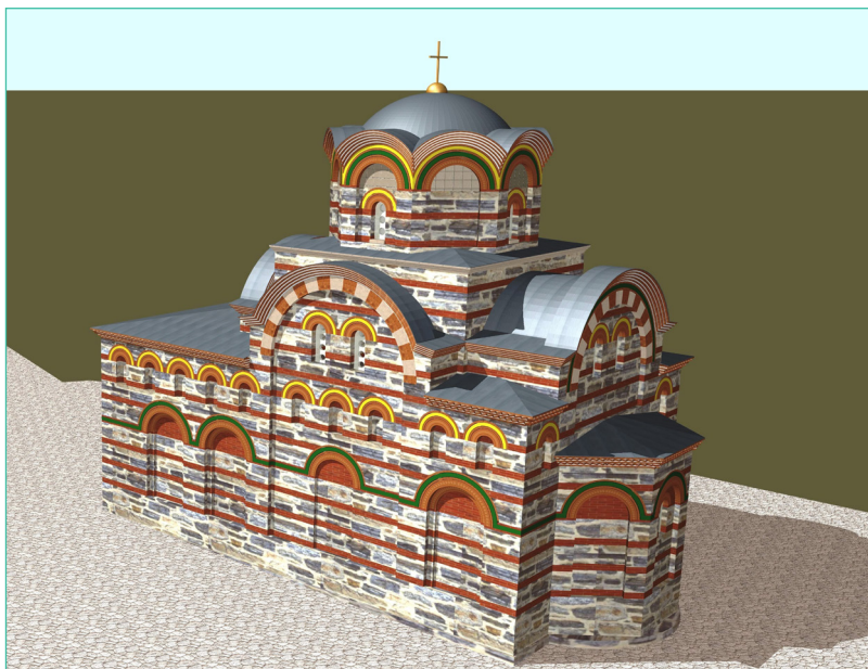
Обр. 1. Църква № 4. Реконструкция (арх. Пламен Цанев)