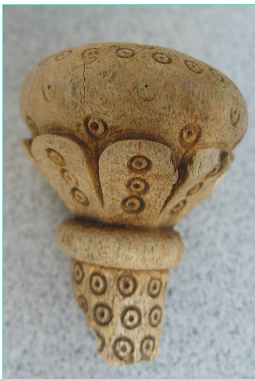
Обр. 8. Костен завършек на архиерейски жезъл открит между комплекси при църкви № 3 и 4