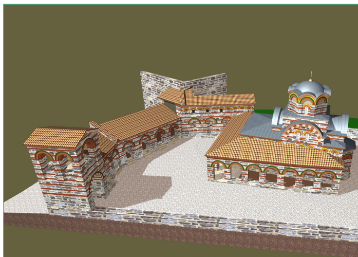
Обр. 6. Комплекс при църква № 4. Реконструкция (арх. Пламен Цанев)