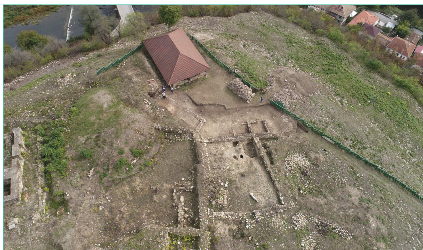
Обр. 3. Комплекс при Църква № 4 на Трапезица