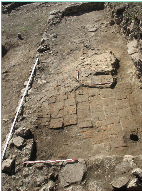
Обр. 5. Поглед към запад в трапезарията на затворения ансамбъл при Църква № 4 на Трапезица