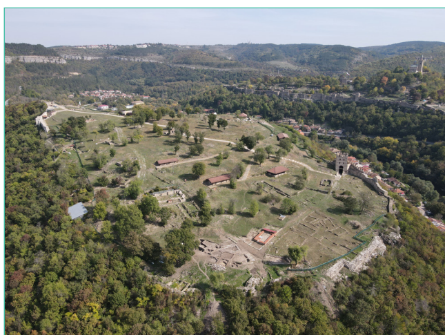
Обр. 2. Южната част на Трапезица с консервираната Църква № 22 на кръстовището на двете главни улици.