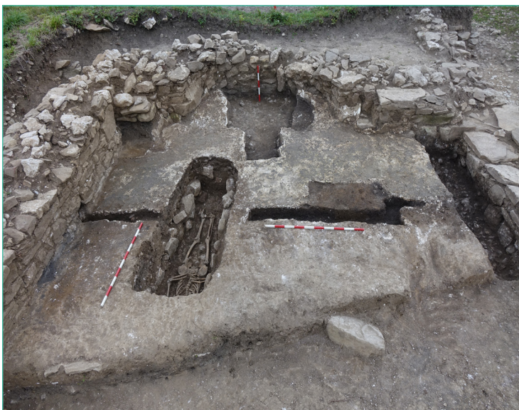
Обр. 4. Олтарна част на Църква № 22 на Трапезица на нивото на хорсановата подложка за пода.