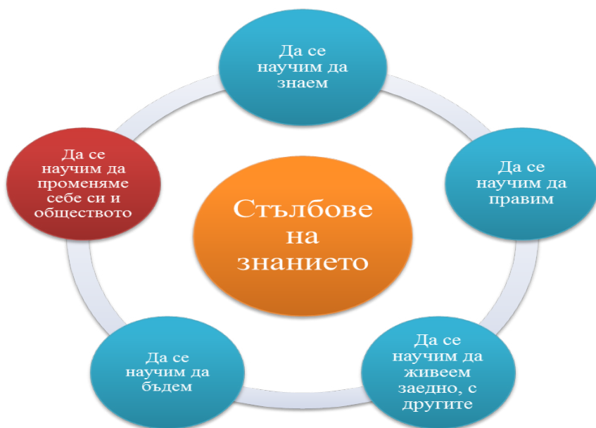
Фиг. 1. Сълбове на знанието 24

Не са необходими само знания, умения и ценности, а нов стил на мислене и ново отношение към глобалните проблеми. Според Б. Димитрова превръщането на информираността в поведенчески стил е възможно след по-често връщане към основните идеи и цели на устойчивото развитие 25 . Считаме, че отбелязването на световните екологични дати е подход за ежегодно осведомяване и призоваване за справяне със съвременните предизвикателства.