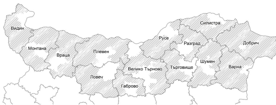
Фигура 1. Териториален обхват на селските райони в Северна България според Наредба 14 за определяне на населените места в селски и планински райони от 2003 г.

У нас селските райони са регламентирани с Наредба 14 за определяне на населените места в селски и планински райони от 2003 г. , в която е записано, че: „Селски райони са общините, на чиято територия няма град с население над 30 000 души и гъстотата на населението е под 150 жители на кв. км“, съгласно което от 265 общини в България, 233 (разпределени в 27 от 28-те области) се определят като селски райони или това е над 80 % от територията на страната. Съответно, тези райони обхващат и по-голямата част от Северна България ( Фиг. 1 ).