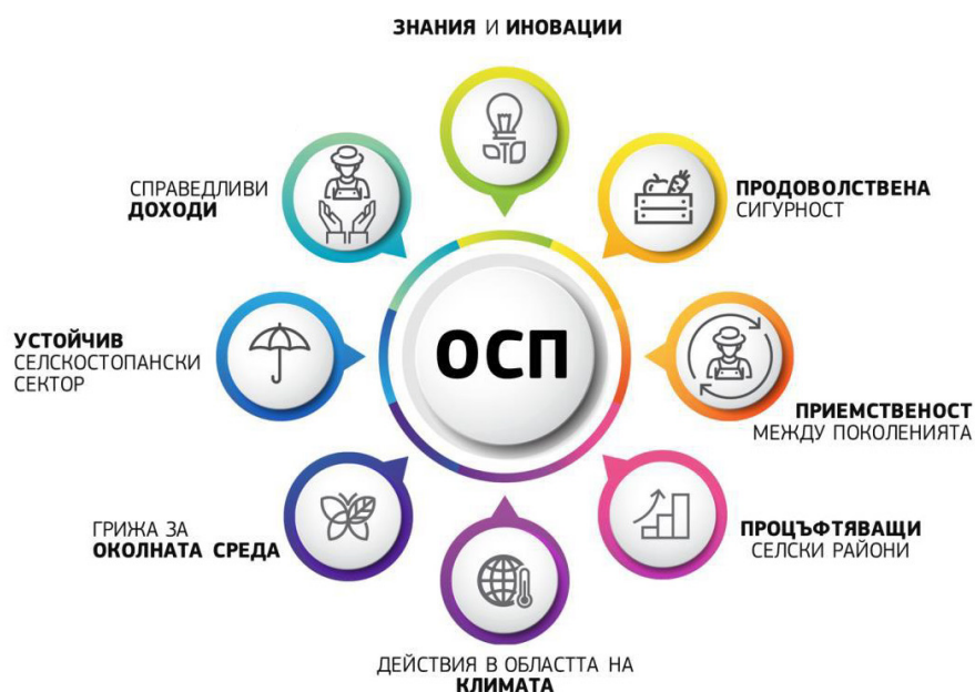
Фиг. 3. Бъдещето на храните и селското стопанство и области на приложение в контекста на Обща селскостопанска политика на Европейския съюз в периода 2021–2027 г.

На национално ниво политическият ангажимент по отношение на цел № 1 „Продоволствена сигурност“ се проявява в координация с другите обособени цели, а именно: