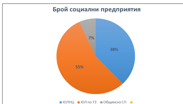
Фиг. 1. Регистрирани социални предприятия по юридическа форма

В рамките на извършеното проучване са анализирани данни за достъп до проектно финансиране на 29 социални предприятия, които са регистрирани в публичния Регистър на социалните предприятия в България и които съгласно нормативните изисквания покриват критериите за социално предприятие. Задължителен компонент на изследването е юридическата форма на регистрираните социални предприятия, която в голяма степен определя и достъпа до различни източници на финансиране, в това число до проектно финансиране. Разпределението на регистрираните социални предприятия по юридическа форма е показано на фиг. 1.