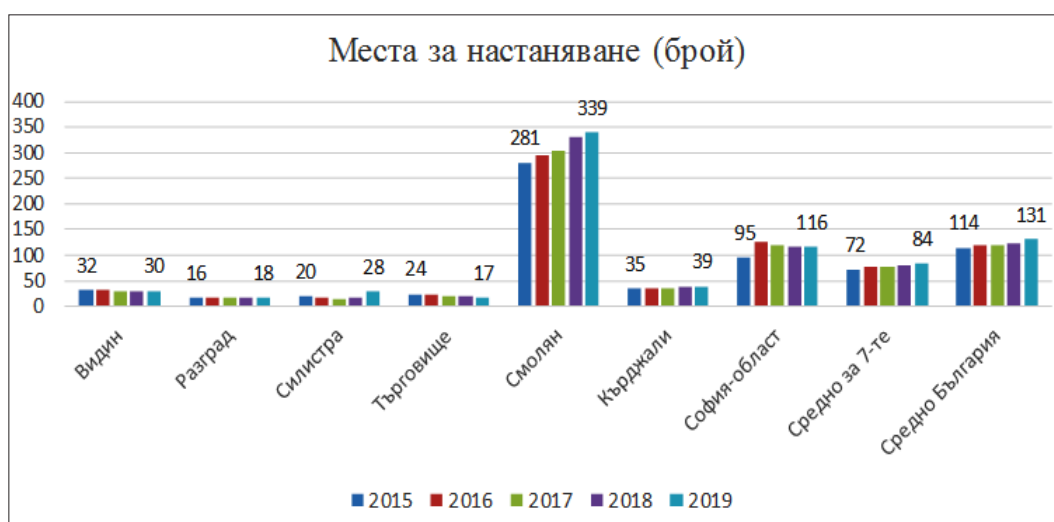
Фиг. 2. Места за настаняване 2

Функционирането на местата за настаняване и реализираните нощувки в тях осигуряват работа на една голяма част от населението в трудоспособна възраст, още повече че за страната ни туризмът е сред важните и структурноопределящи отрасли на икономиката ни.