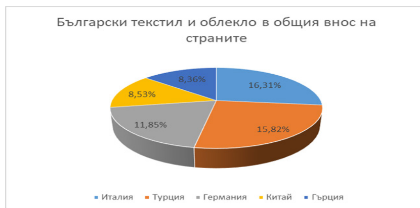
Фиг. 2. Дял на българския текстил и облекло в общия внос на страните

Индексът на продукцията на предприятията в сектора за периода от 2019 до 2021 г. е в интервала от 96,6 до 116,3 (Statistical reference book, 2022, p. 193). Произведеният текстил и облекло в страната се изнася основно за Турция, Италия, Германия, Гърция и Китай (фигура 2).