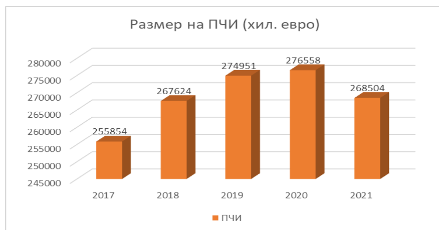
Фиг.3. Динамика на ПЧИ

По отношение на преките чуждестранни инвестиции (ПЧИ) за последните 5 години в сектора се наблюдава тенденция за плавното увеличаване на инвестициите в периода от 2017 до 2020 г. и намаляването им през 2021 г. (таблица 10). Анализът на данните показва, че през 2021 г. ПЧИ в сектора са намалели с 8054 хил. евро, спрямо предходната 2020 г. Динамиката на ПЧИ е представена на фигура 3.