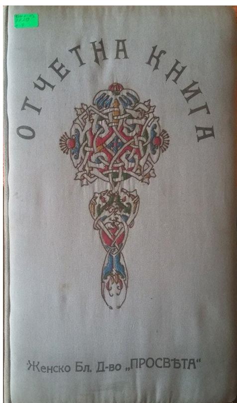
Обр. 4. Отчетна книга на Женско благотворително дружество „Просвета“