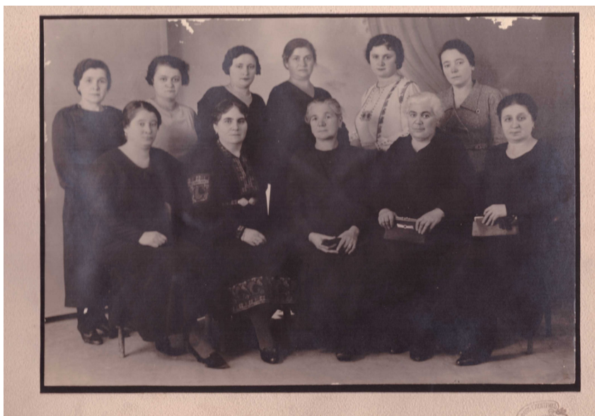
Обр. 3. Настоятелството на Женско благотворително дружество „Просвета“ 1935 г.