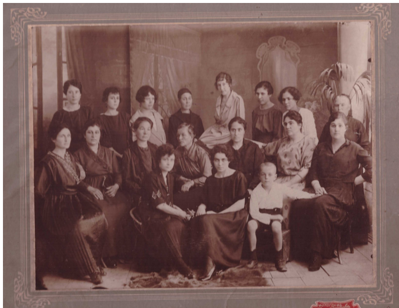
Обр. 1. Настоятелството, театралният комитет и учителките от Стопанското училище при горнооряховското женско благотворително дружество „Просвета“ 1921–1922 г.