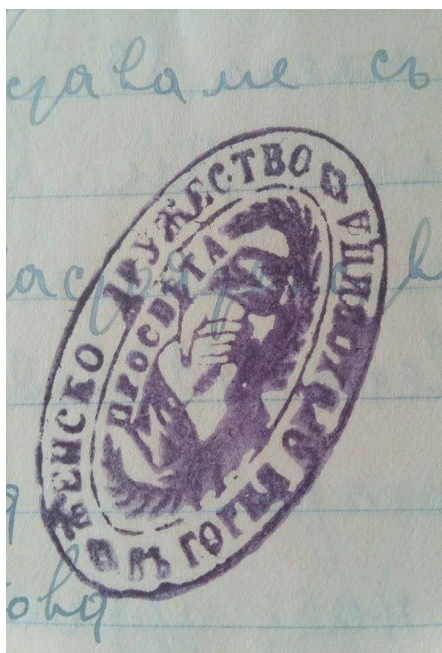
Обр. 6. Печат на Женско благотворително дружество „Просвета“