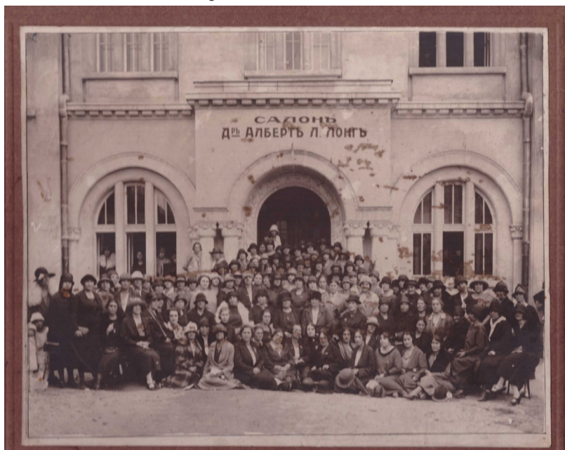
Обр. 2. Делегатите на XIV ти редовен конгрес на Български женски съюз (БЖС), 1920 г.