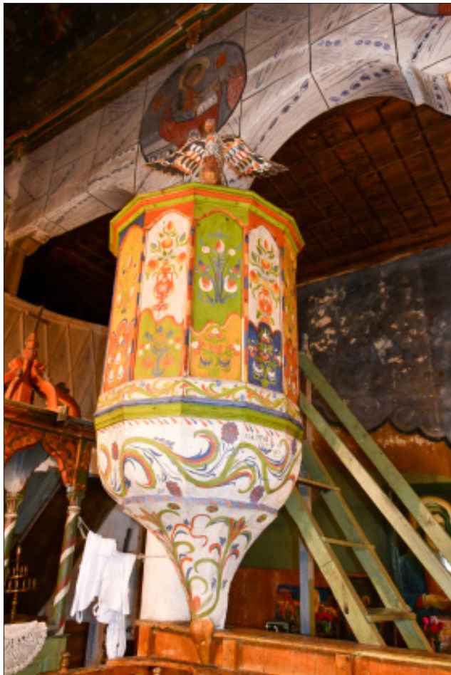
5. Църквата „Успение Богородично“ в с. Огняново, Гоцеделчевско. Амвон

правоъгълните и триъгълни пана под тях. Изображенията намират паралел в аналогични образи на сирени от амвоните на Метохинската църква в Самоков и църквата „Св. Николай“ в Берковица (Ангелов 1992: обр. 109, 113). С основание Валентин Ангелов определя изображенията на сирени от амвона на църквата „Успение Богородично“ в Благоевград като ехо от древните средиземноморски цивилизации (Ангелов 1986: 63).