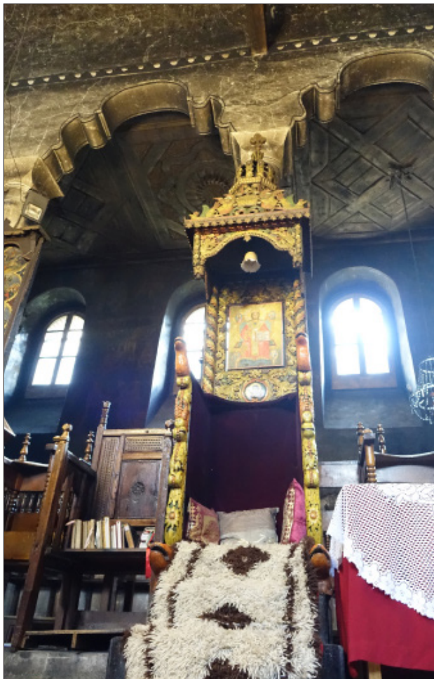
2. Църквата „Въведение Богородично“ в Благоевград. Владишки трон.

Х в. (Луитпранд Кремонски 2015: 228–229). Апотропейни функции вероятно има и двуглавият змей, изрязан върху челото на балдахина на трона на църквата „Въведение Богородично“ в Благоевград.