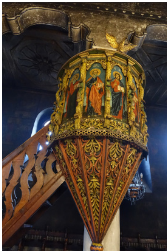
6. Църквата „Въведение Богородично“ в Благоевград. Амвон.