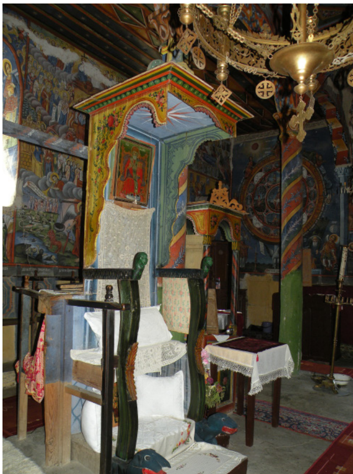
4. Църквата „Св. Йоан Предтеча“ в с. Бистрица, Благоевградско. Владишкият трон

Останалите владишки тронове са разположени най-вече в селски църкви от региона на Юго-западна България. Те са семпли като архитектура и декорация, предимно живописна, доколкото я има, с доминиращи растителни мотиви и почти навсякъде с грубо резбовани змейски глави, в подножието на троните, а понякога и върху ръкохватките им. Сред тях по-специален интерес представлява тронът от църквата „Св. Йоан Предтеча“ в с. Бистрица, Благоевградско (обр. 4.). Змейските глави в подножието на трона, ако и да са примитив, са относително добре скулптирани. Оцветени са в синьо, като устата и езикът им са в червена багра, което им придава страховит вид. Ръкохватките са оформени като змии, с излизачи напред, скулптирани птичи глави. Оцветени са в зелено, което напомня за функциите на змията змей, стопан и дарител на плодородие, от българската народна вяра. Балдахинът, макар и пестеливо, е декориран с рисуван растителни мотиви и завършва горе с корона. И тук архитектурата на трона напомня въпреки семплата декорация за структурата на космическото дърво. Оцветяването на мотивите от този трон обаче е по-близко до народното цветоусещане, известно ни например от традиционните тъкани в региона.