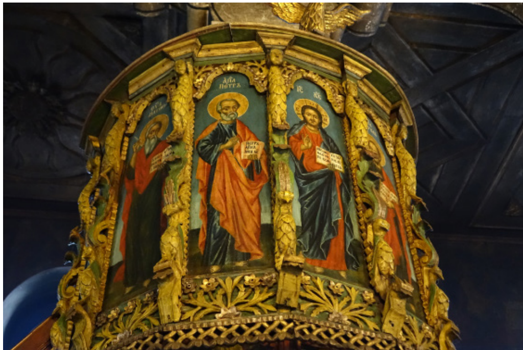
8. Църквата „Въведение Богородично“ в Благоевград. Амвон. Детайл.

Пенчева, Марков, Костадинова 2021: Жана Пенчева, Васил Марков, Петя Костадинова. Християнски храмове от Югозападна България. Благоевград: УИ „Неофит Рилски“, 2021. [Pencheva, Markov, Kostadinova 2021: Zhana Pencheva, Vasil Markov, Petya kostadinova. Hristiyanski hramove ot Yugozapadna Balgaria. Blagoevgrad: UI „Neofit Rilski“, 2021.]