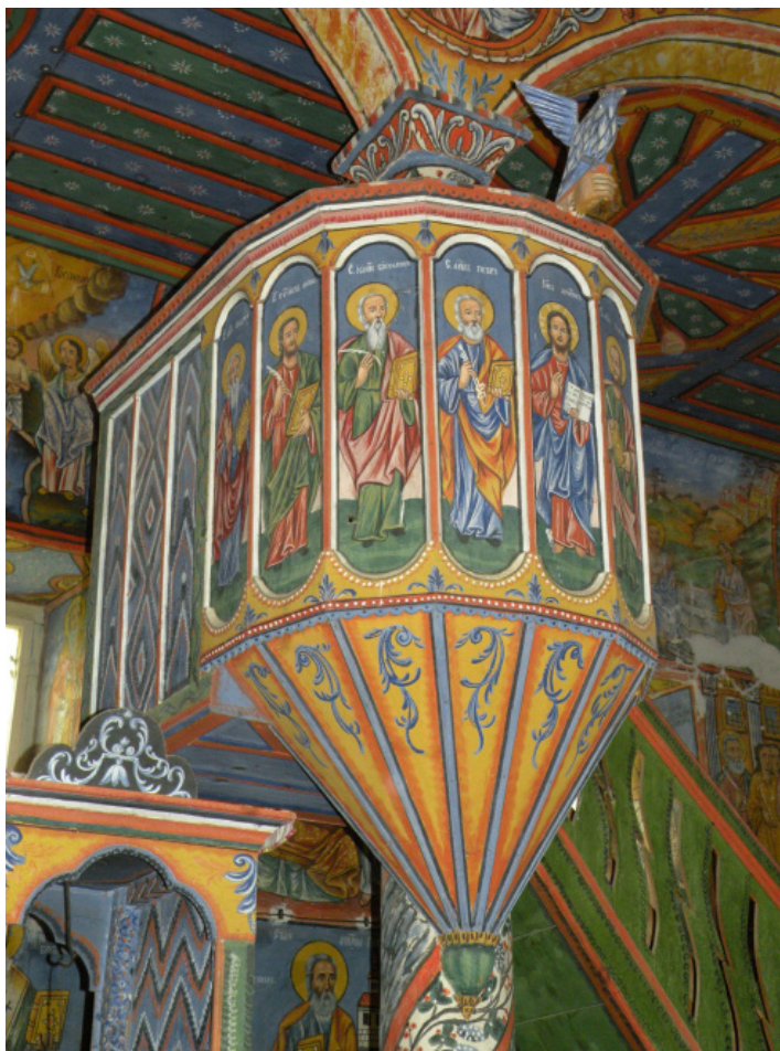
7. Църквата „Св. Димитър“ в с. Дренково, Гоцеделчевско. Рисуван амвон

В художествен аспект трябва задължително да се отбележи забележителното полихромие на интериора на християнските паметници в Югозападна България от епохата на Късното възрождане, сред което са разположени изследваните символи. Това е греещ, приказен и празничен свят, толкова близък до народното изкуство, а и до народопсихологията на българите като цяло.