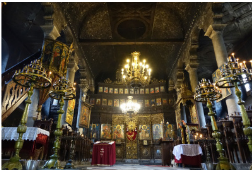
1. Църквата „Въведение Богородично“ в Благоевград. Интериор.

си възшествие византийския император Юстиниан II стъпнал с пурпурните си обувки главите на победените си врагове на Хиподрума, а народът пеел: „Ти ще стъпчеш змийте и ламите“ (Дил, Рамбо 1992:23).