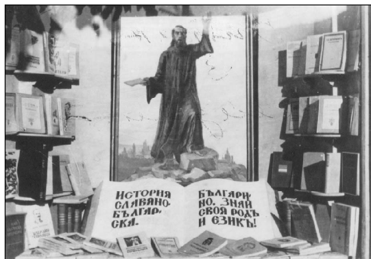
Витрина за 24-ти май