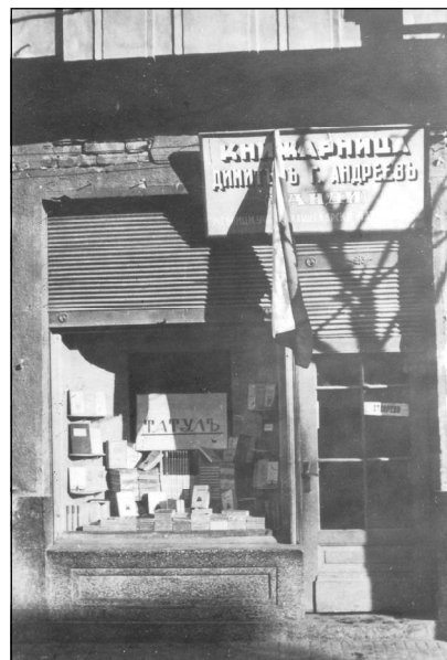
Външен изглед на книжарница „Ганди“