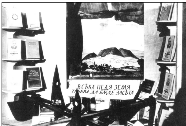
Витрина за земеделците