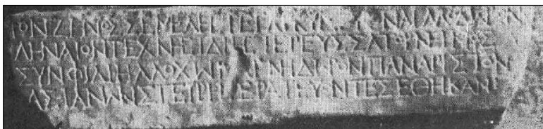
Фиг. 1. Старогръцка епиграма от Монтана (IGBulg. II 480)

Паметникът (Фиг. 1) е един от малкото метрични надписи от нашите земи, свързани с култа на Дионис. Според Геров (1954: 171, п. 277) надписът е от времето на северите, а според Велков и Александров (1994: 34) датировката е втората половина на II век.