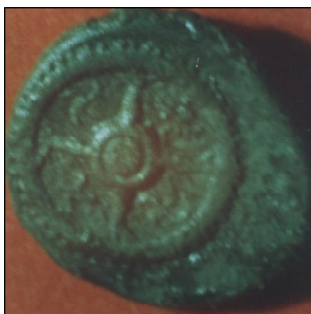
Обр. 2. Колело със свастики върху месамбрийски обол (първа половина на V в. пр. Хр.)