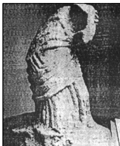
Обр. 10. Статуята на Аполон Карсенос от тракийското светилище на връх “Шилото” край Бургас (25 – 38 г. след Хр.)