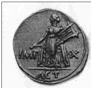
Обр. 11. Денар на Август с Аполон Аксиус

Южно Черноморие, то това би следвало да се подчертае не само с иконографска идентичност, но и словесно.