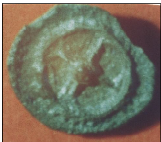
Обр. 1. Ревърс на месамбрийски обол с колело без надпис (първа половина на V в. пр. Хр.)

Върху най-ранните оболи на Месамбрия имаме колело с четири спици с миниатюрно щитче в средата (Обр. 1), а по-късно между спиците се появяват свастики (Обр. 2). Тези монети могат да се датират най-общо през първата половина на V век пр. Хр. Към тях напоследък се добави и една анеипиграфна драхма с глава на Мелсас надясно в единия сектор и свастика в срещуположния (Обр. 3а и б).