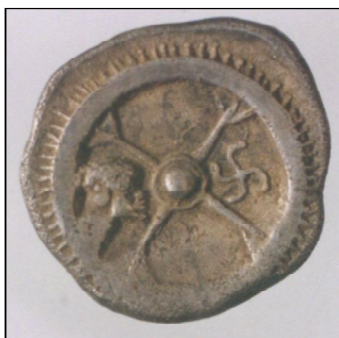
Обр. 3а и 3б. Драхма на Месамбрия с Мелса и свастика (първа половина на V в. пр. Хр.).