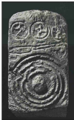
Обр. 7. Менхирът от Substantion (Южна Франция)

От елинистическия некропол на Месамбрия са ни познати златни висулки на обеци, моделирани като плоско изображение на Нике. Фигурката на крилатата богиня е закачена на кръгче с осем спици и къси лъчевидни израстъци (Гълъбов, 1955: