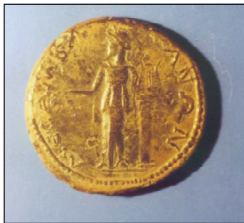
Обр. 12. Бронзова монета на Хадриан, сечена в Месамбрия

месамбрийските типове на Аполон, сечени при Хадриан (Обр. 12), Септимий Север, Каракала, Гета, Гордиан и Транквилина, Филип и Отацилия и Филип Млади.