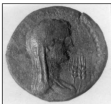
Обр. 9. Бронзова монета на Месамбрия от типа “Деметра – Аполон”

Иконографският тип “Аполон с дълга дреха и лира” напоследък беше свързан с влиянието на римската пластика от епохата на Август върху пластиката в древна Месамбрия (Роков, 2001). Тази интерпретация е неприемлива. Независимо че иконографският тип на Аполон от месамбрийските монети “Деметра – Аполон” и “Август – Аполон” е близък до Аполон Аксиус (Jucker, 1982: 82–104) от реверса на Августовите денари (Обр. 11), ние трябва да се съобразим с наличието на облечена статуя от светилището на връх Шилото при Бургас, което е било посветено на Аполон Карсенос (Απόλλωνος Καρσηνός) (Кияшкина, 2000: 109–110). Ако знаменитата победа при нос Акции беше упражнила някакви политическо въздействие върху градовете от днешното българско