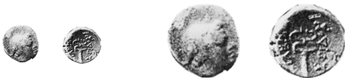
Фотос мащаб 1:1

Опако: ΒΑΣΙΛΕΩΣ (вертикално ляво) ΜΟΣΤΙΔΟΣ (вертикално дясно). Между надписите – основният атрибут на Хермес кадуцей.