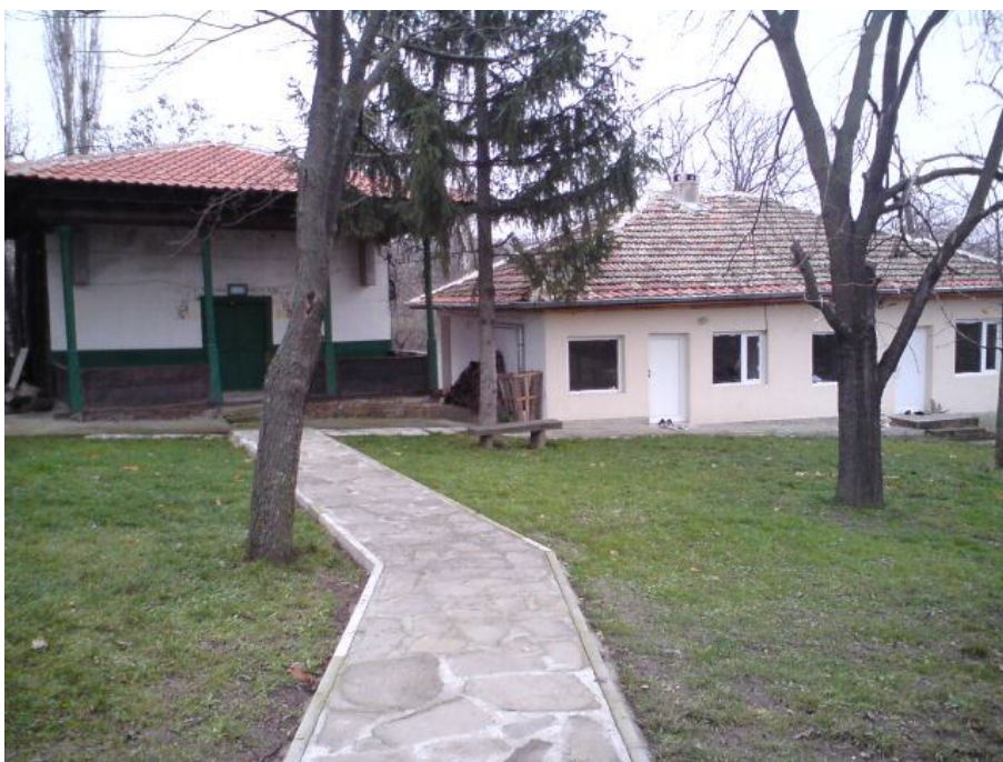
Джамия в с. Ябланово