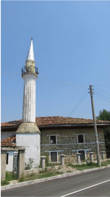
Джамия в Горната махала на с. Бяла река (1871–1872)