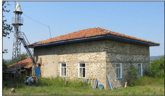
Джамия в Долната махала на с. Бяла река (1805–1806)