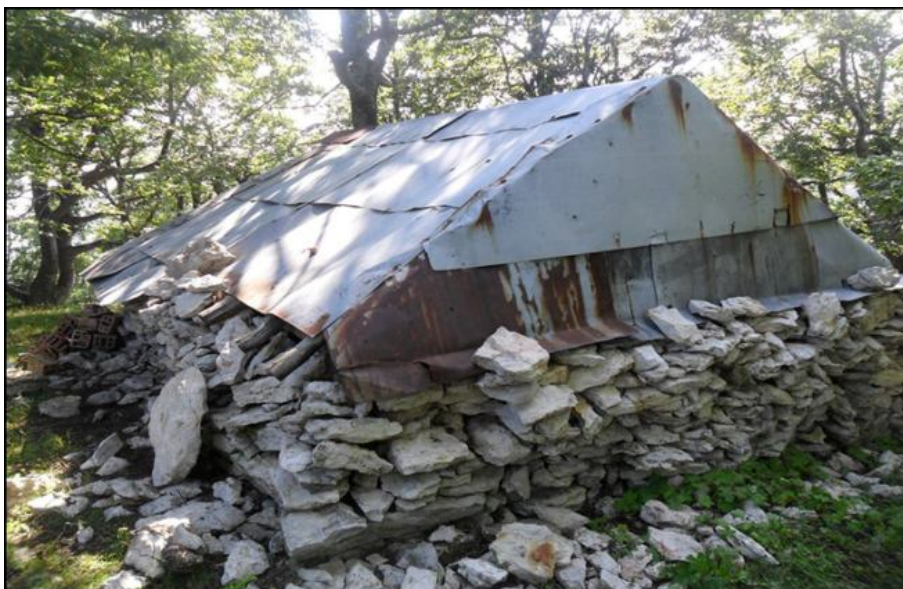
Турбе на Али боба край с. Ябланово 4