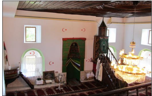
Минберът, кюрсът и балконът в джамията в Горната махала на с. Бяла река