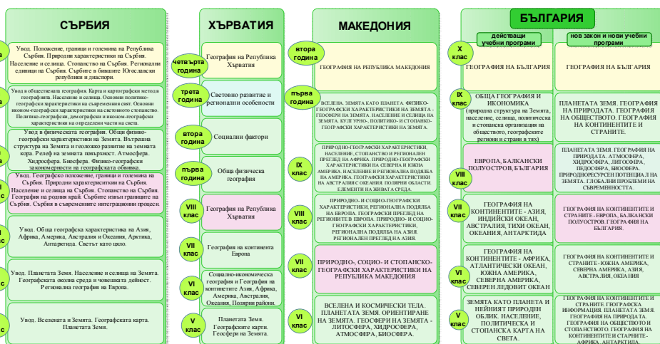
Фиг. 3. Структурно-съдържателна рамка на учебното съдържание по учебни програми в България, Хърватия, Македония и Сърбия

**В зависимост от рамковия учебен план са различно разпределени по класове, но с еднакъв общ хорариум учебни часове за първи гимназиален етап – IX клас е 2/72 уч. часа и X клас 2,5/90 уч. часа (общо 162 учебни часа) или VIII клас – 1/36 уч. часа, IX клас – 1/36 уч. часа, X клас – 2,5/90 уч. часа (общо 162 учебни часа).