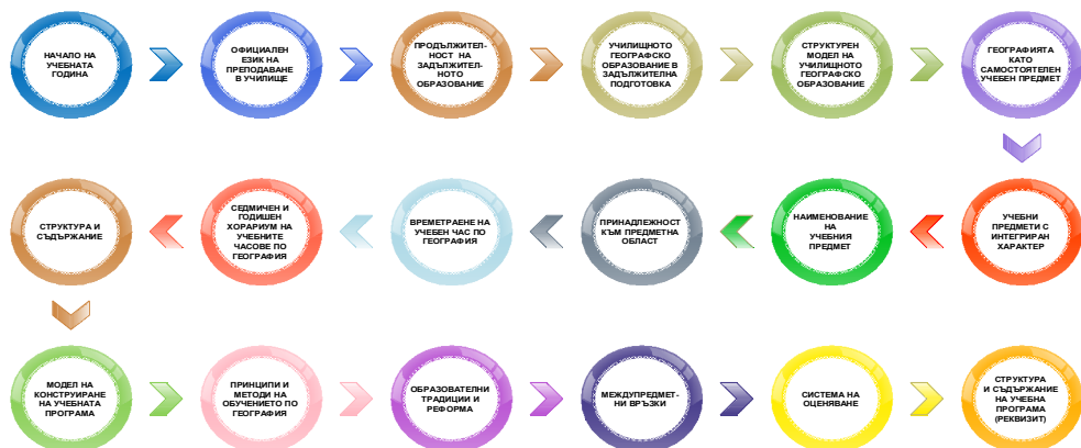
Фиг. 1. Детерминирани показатели за сравняване на училищното географско образование между България, Хърватия, Македония и Сърбия

международно сътрудничество. Глобализационните процеси в образованието са носители на образователна интеграция и мобилност, обмяна на опит и идеи, откриване на възможности и изучаване на чуждия опит. В методическата литература има изследвания относно съдържателните и процесуалните аспекти на обучението по темата, но не и за периода след 1990 г., защото страните са поставени в различни и противоречиви условия на социални и икономически, политически и културни измерения. Сравняването на училищното географско образование е по учебни програми между страните България, Хърватия, Македония и Сърбия по детерминирани показатели (фиг. 1).