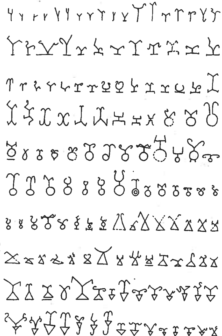
Табл. 1. Основни варианти на ипсилоноподобни знаци от Северното Причерноморие през античността (по В. С. Драчук).

62 Драчук, В. С. Цит. съч., 105–109, табл. XXXII – LI.