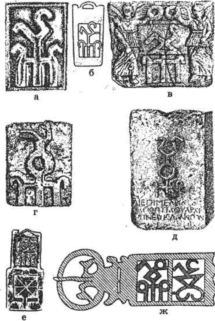
Табл. 3. "Сложни" царски знаци върху плочи, стели, надписи и коланни апликации: а. Знак на Римиталк (?) върху плоча от Танаис; б. Знак на Римиталк върху коланна апликация; в. Плоча от Таманския полуостров със знак на Тиберий Евпатор, увенчаван от фигури на Нике; г. Плоча със знак на неизвестен боспорски цар; д. Плоча с надпис и знак на Савромат II; е. Ажурна тока за колан със знак на Тиберий Евпатор; ж. Ажурна тока за колан със знаци на Римиталк (?) и сарматска хералдична емблема (по В. С. Драчук).