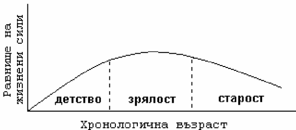
Крива 1. Жизнен цикъл на човешкото развитие

детството се случват повече важни събития влияещи върху телесното, социалното и психо-духовното битие на индивида, отколкото в зрялата възраст и старостта взети заедно. Това рефлектира и в броя на периодите, на които се разчленяват трите възрасти. Периодите се групират в големи възрасти, поради общото си качество. През детството жизнените сили на индивида са нагоре, те нарастват и се диференцират. През зрялата възраст жизнените сили са относително устойчиви, стабилни, и продължават да се диференцират. През старостта жизнените сили обикновено са в упадък, който постепенно се ускорява. По хронологическа продължителност втората възраст (зрелостта) е приблизително равна на първата (детството) и третата (старостта) взети заедно. В детството всеки “бърза да порасне”, а на границата между зрелостта и старостта се бави да признае, че вече е станал стар човек. Динамиката на жизнените сили в трите възрасти може условно да се онагледя със следната крива: