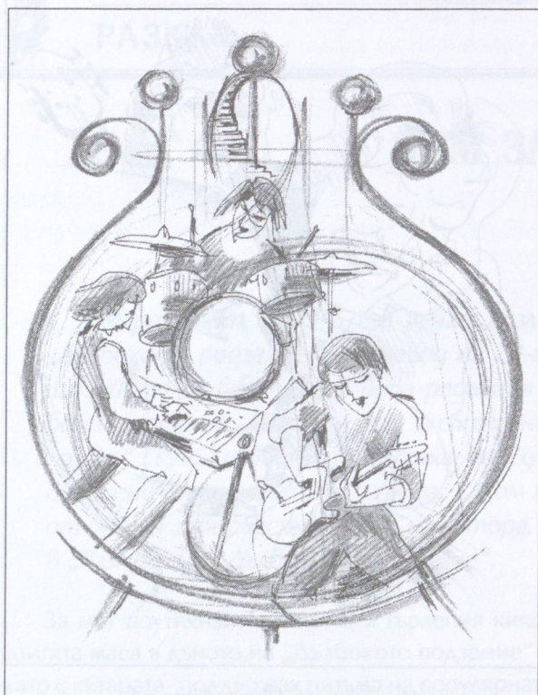
Илюстрация Евгени Стоянов