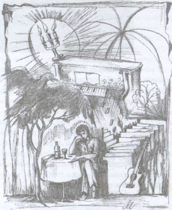
Илюстрация Маргрета Григорова

Бяхме двамата, без барабанист и басист, но това не ни пречеше да летим назад във времето, да се носим върху крилете на невероятната импровизация, която сякаш бе изчистила посърналото лице на Звездан и сега то изглеждаше озарено от една блага, дори щастлива усмивка. Синтезаторът, елитна японска марка, заместваше липсващите ритмични инструменти. Купил го бе доста скъпо по време на