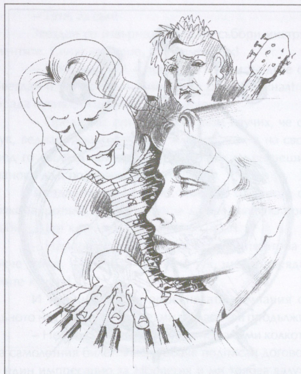
Илюстрация Евгени Стоянов

Кимвах. Мима, вдървена и уплашена, тази вечер съвсем не бе в час. Скрита зад нас, застанала в края на подиума, тя пишеше все по-пронизително и аз вече не успявах да догоня препускането ѝ по мелодията. Щом на финала Мима се провали в опит неуспешно да вдигне фалцет при заключителната фраза, Звездан, видимо притеснен от реакцията на пияните тузари, се извърна към нея: „Долу!“. Мима подви опашка и почти се скри зад масата. Управи-