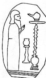
Фиг. 6. (Рис. 3. Тархан)