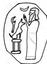
Фиг. 4. (Рис. 3. Тархан)