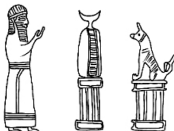
Фиг. 2. (Рис. 3. Тархан)