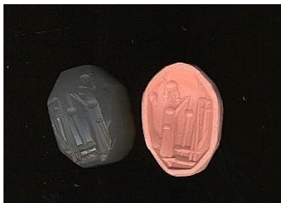
Фиг. 7.