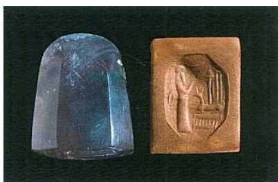
Фиг. 5. (Andre-Salvini 2008, № 176)