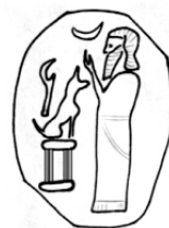
Фиг. 4. (Рис. 3. Тархан)