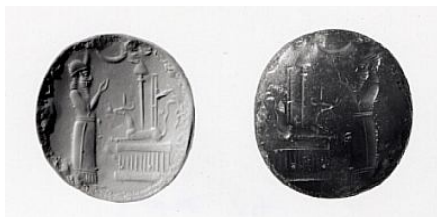
Фиг. 3.