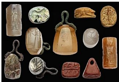
Фиг. 1. Маркови и цилиндрови печати

VA, VA Bab. – Vorderasiatisches Museum, Berlin.