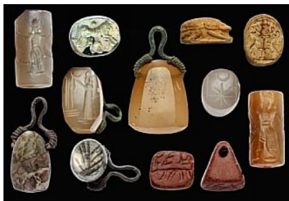
Фиг. 1. Маркови и цилиндрови печати

VA, VA Bab. – Vorderasiatisches Museum, Berlin.