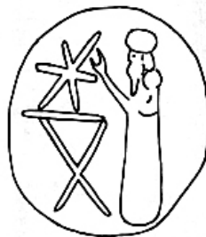
Фиг. 8. (Рис. 3. Тархан)