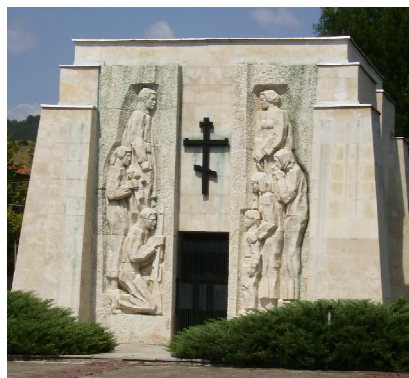
Обр. 2. Паметник-костница на площада в село Скравена