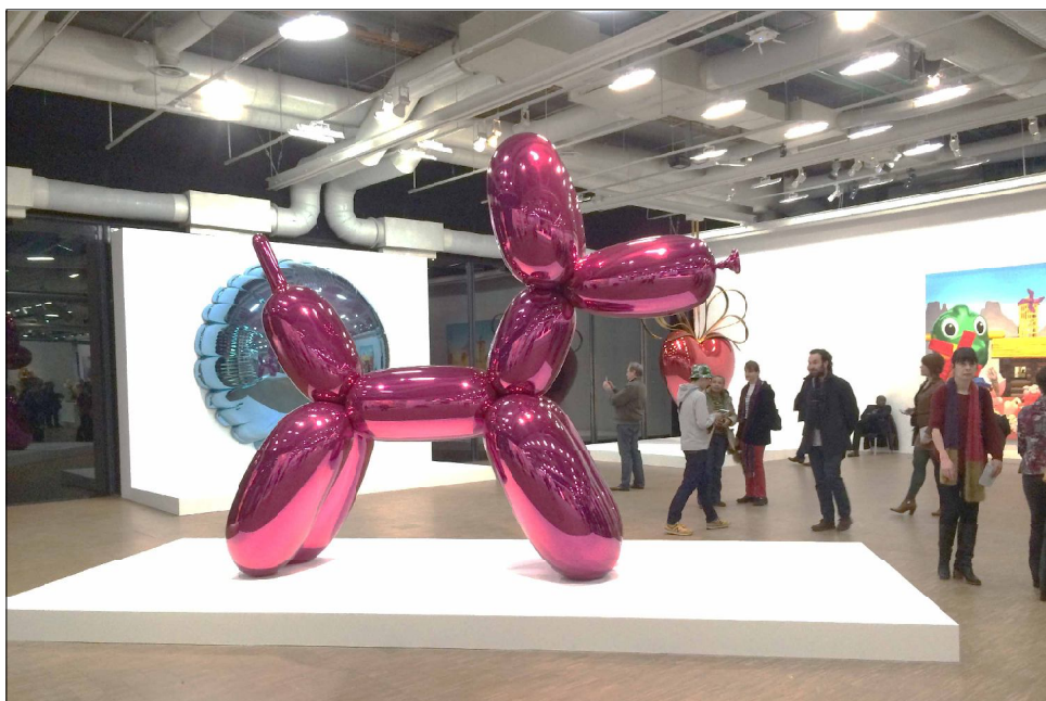
Снимка № 7 Изложба на Джеф Куунс/Jeff Koons в Париж 2015, личен архив

Едни и същи неща се предлагат като предмети от ежедневието ни, а копирани, но с различен мащаб ги виждаме в най-големите музеи по света. Като първосигнален пример тук в съзнанието ми веднага изплуваха фигурите на кученца от балони на Джеф Куунс/Jeff Koons (снимка № 7). Но тук вместо играчки за деца, увеличени и експонирани, като скулптури.