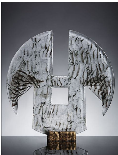
Снимка № 1 Скулптура от стъкло, автор Моника Найденова

Лично за себе си мога да споделя, че като автор, използващ най-основно материала стъкло за изразно средство, често се намествам между изящното и приложното (снимки № 1 и 2). Това криволичене неведнъж ме провокира да размишлявам относно класификацията на произведения от съвременното ни изкуство, което се оказва на пътя на комерсиализацията, вплетено в ежедневието, но също така стремящо се да се разграничи от него. В категорията „обект“ намират място онези творчески търсения, подчинени на схващането за единно представяне и цялостно изграждане. Функцията често присъства, но не е задължителна. Обектът е възприеман като художествено произведение сам по себе си. Нека разгледаме някои примери на такива обекти от стъкло.