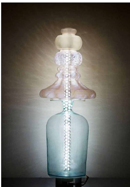
Снимка № 6