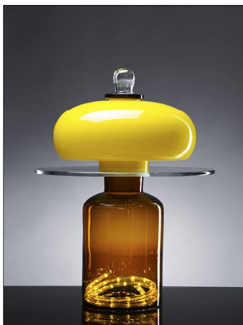
Снимка № 5