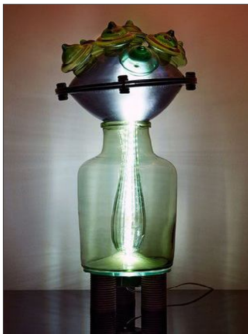
Снимка № 3 Автор Моника Найденова

В глобалния ни свят, където масовата култура се е настанила удобно, все по-често се наблюдава унифициране на предлаганите стоки, изделия и произведения. Авторът, от своя страна, в стремежа си да е актуален, но и да остане все пак артист, се опитва да предложи на публиката нещо ново. Но нека разгледаме връзката между по-абстрактния художествен предмет и реалния контекст, в който той се появява или в който продължава да съществува и да се „употребява“. Предпоставка ли е материалът, изграждащ творбата и средата, в която тя живее, да спомагат за класифицирането ѝ?