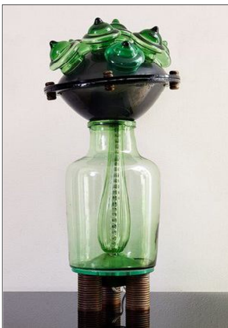
Снимка № 4