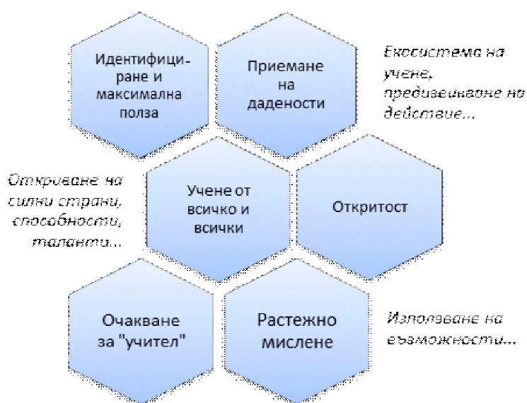
Фиг. 1. Стратегически възможности в подготовката на студенти педагози за развитие на компетентността предприемачество

Основен фокус в обучението на студентите педагози в компетентността предприемачество е въпросът как да бъдат подпомогнати да учат от всичко възможно по всякакви начини. Отговорите са многозначни. От практиката се открояват следните по-важни стратегии (фиг. 1).