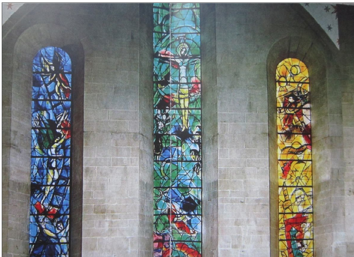
5. Витражите в катедралата „Фраумюнстер“ гр. Цюрих, Швейцария, 1978 г.