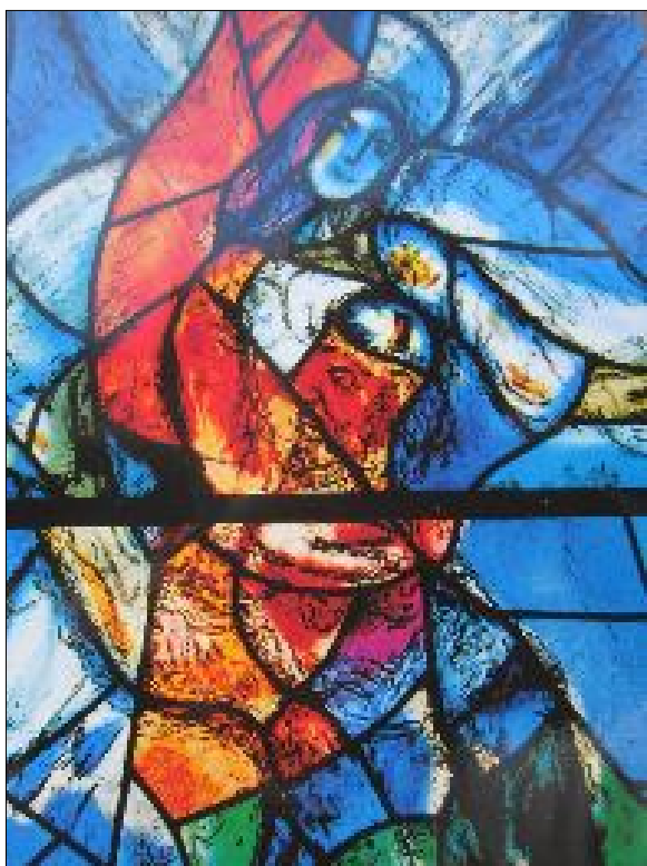
7. Детайл от витражите в катедралата „Фраумюнстер“ гр. Цюрих, Швейцария, 1978 г.