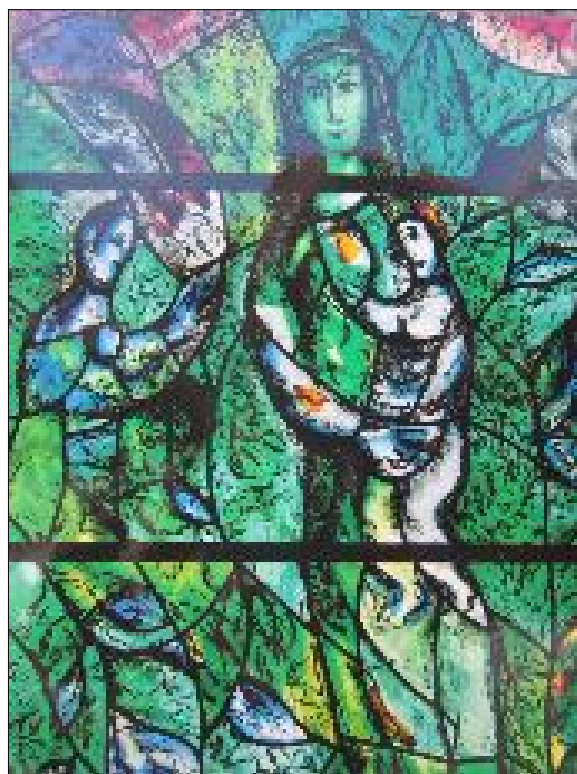
8. Детайл от витражите в катедралата „Фраумюнстер“ гр. Цюрих, Швейцария, 1978 г.