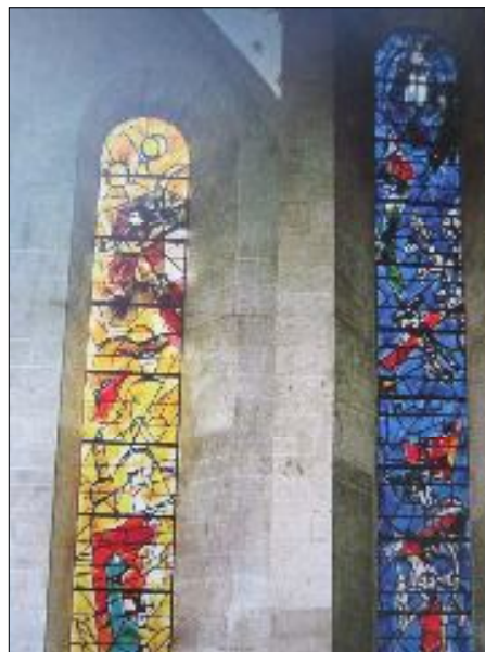
6. Витражите в катедралата „Фраумюнстер“ гр. Цюрих, Швейцария, 1978 г.