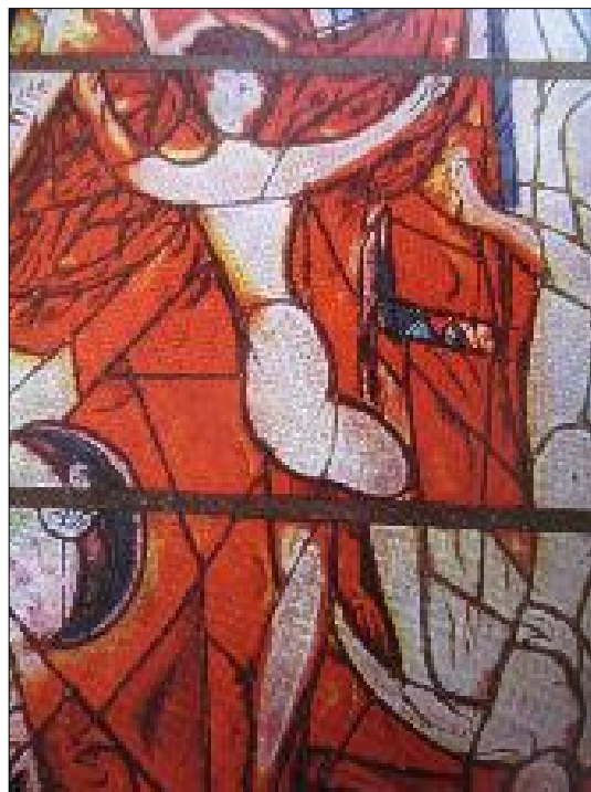
2. Детайл от витражите в катедралата в Мец, Франция, 1960 г.