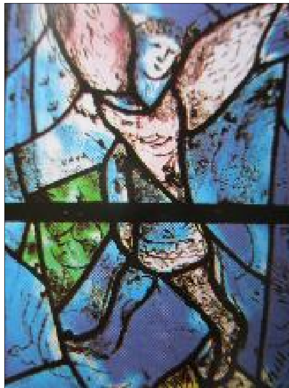
4. Детайл от витражите в катедралата „Св. Стефан“ в гр. Майнц, Германия 1976 г.