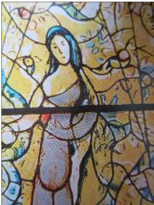
1. Детайл от витражите в катедралата в Мец, Франция, 1960 г.