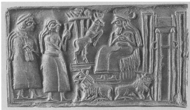
фиг. 1. Сцена от цилиндричен печат VA 3878 от РДЕ III (no Reade 2003, 122, fig. 37)