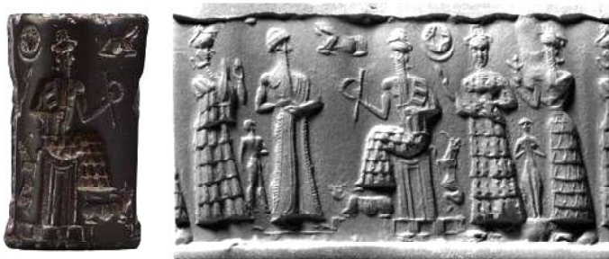
фиг. 5. Цилиндричен печат MS 0391 от старовавилонската епоха