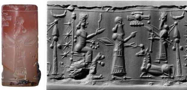
фиг. 7. Цилиндричен печат MS 0694 от новоасирийската епоха