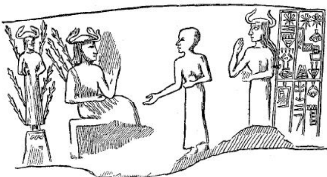
фиг. 9. Сцена от цилиндричен печат от времето на цар Нарам-Син (no Ward 1910, 136, fig. 386)