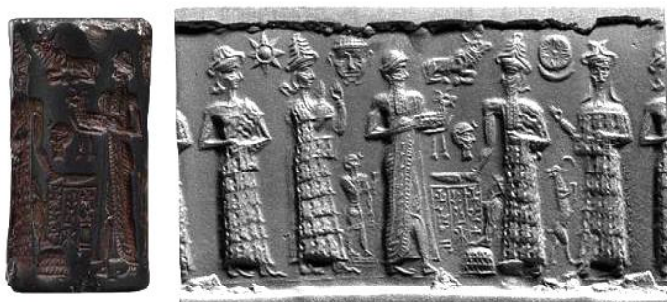
фиг. 6. Цилиндричен печат MS 0399 от старовавилонската епоха (Morgan Library and Museum, Collection Online)