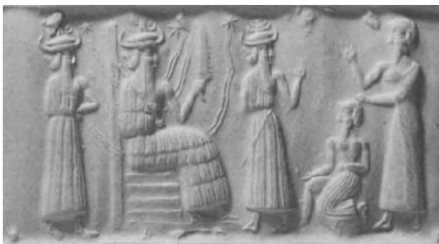
фиг. 2. Сцена от цилиндричен печат IM 50748 от акадеката епоха (no Collon 1987, 34, fig. 104)