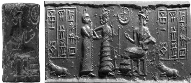
фиг. 4. Цилиндричен печат MS 0277 от епохата Ур III (Morgan Library and Museum, Collection Online)