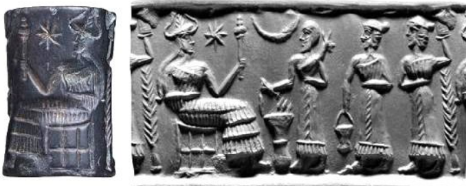
фиг. 3. Цилиндричен печат MS 0245 от акадеката епоха