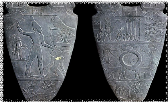
Фиг. 8. Палитра на Нармер, Египетски музей Кайро, музейен номер CG 14716

Фиг. 9. представя цилиндричен печат, в сцената на който е гравирани детайл, представляващ фигура с едно око. От хилядолетната история на Месопотамия до нас са достигнали само още два други примера за този мотив. Единият откриваме върху цилиндър от раннодинастическата епоха в Двуречието, а другият – в много по-късната релефна плоча от Хафадж 19 . Като аналогия на образа несъмнено може да съпоставим много по-късната митична древногръцка фигура на едноокия циклоп. От това сравнение мотивът в шумерските паметници е наречен по същия начин – циклоп.