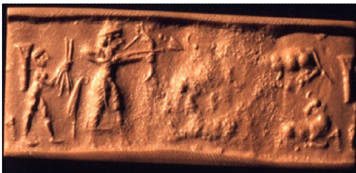
Фиг. 4. Цилиндричен печат от бял камък, Британски музей, музеен номер BM 131440

плавателното средство са гравирани поклонници, първият, от който държи предмет, наподобяващ гребло. Между тях се намира фигурата на царя жрец, който е изобразен със скръстени пред гърдите си ръце, с които изглежда държи нещо, а от двете му страни са гравирани изображения на храм/маса и бик. Върху животното е изобразена стъпаловидна структура, която би могла да представлява платформа за поставяне на статуя. От двата края на предмета са изобразени тръстикови снопове 15 .