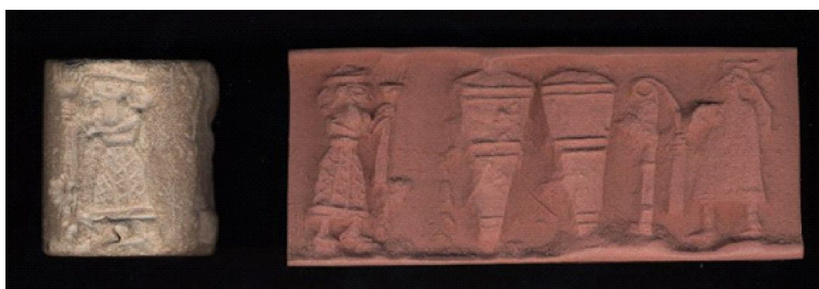
Фиг. 2. Цилиндричен печат от варовик, Британски музей, номер BM 116721

Фиг. 1. представя царя жрец в центъра на образното поле на цилиндричен печат от мрамор, съхраняван в Държавния музей в Берлин с музеен номер VA 10537 12 . В двете си ръце той държи растения, с които храни животни. В двата края на сцената са изобразени тръстикови снопове, а между тях – малко животно над два предмета. Сноповете представляват клинописната идеограма на шумерската богиня на плодородието, любовта и войната Инанна 13 .