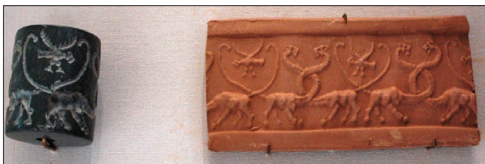
Фиг. 7. Цилиндричен печат от зелен камък, Лувър, музеен номер MNB 1167

Някои детайли, изобразяващи митични същества и зверове, не могат да бъдат лесно класифицирани. Цилиндър, съхраняван в Лувъра, с музеен номер BNB 1167 представя мотив с хибридно същество, наречено от изследователите серпопард (виж фиг. 7.). Мотивът от този печат, открит в Урук през едноименния период, има аналогия с изображение на серпопард, изобразен върху известната египетска „Палитра на Нармер“, датирана отново от края на IV хил. пр.Хр. (виж фиг. 8.).