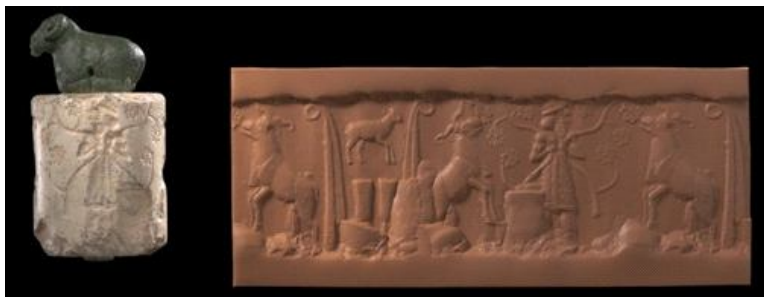
Фиг. 1. Цилиндричен печат, Държавен музей Берлин, музеен номер VA 10537

Фиг. 1. представя царя жрец в центъра на образното поле на цилиндричен печат от мрамор, съхраняван в Държавния музей в Берлин с музеен номер VA 10537 12 . В двете си ръце той държи растения, с които храни животни. В двата края на сцената са изобразени тръстикови снопове, а между тях – малко животно над два предмета. Сноповете представляват клинописната идеограма на шумерската богиня на плодородието, любовта и войната Инанна 13 .