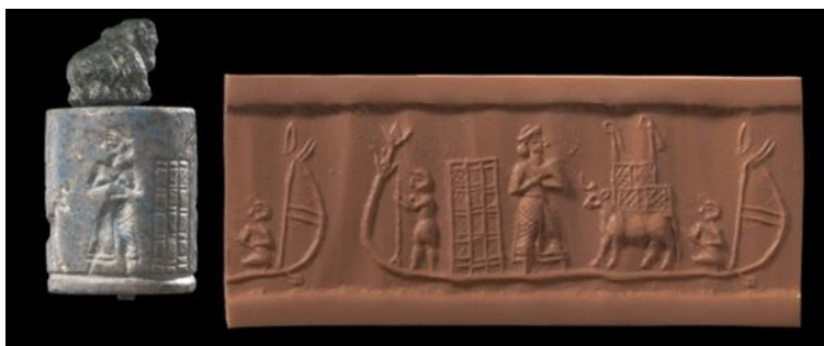
Фиг. 3. Цилиндричен печат от лазурит, Държавен музей, Берлин, музеен номер VA 11040

Брандс посочва сцените с лодки като отделен мотив, който според него е бил използван от отдел на администрацията, занимаващ се с риболов и напояване. В религиозните представи на шумерите лодката е била средството, с което слънчевият и лунният бог се придвижвали по небосклона. Това е разказано в по-късни текстове, в които се описват ритуални шествия с лодки и пренасяне на божествени статуи с тях, но трябва да се отбележи, че това е и основното предпочитано в Двуречието превозно средство въобще 14 . През III хил.пр.Хр. в сцените на паметниците започват да се изобразяват божества в лодки, отличителната божествена черта, на които е рогатата корона. При царя-жрец тя липсва, но и той е изобразяван в сцени с лодка (виж фиг. 3.).