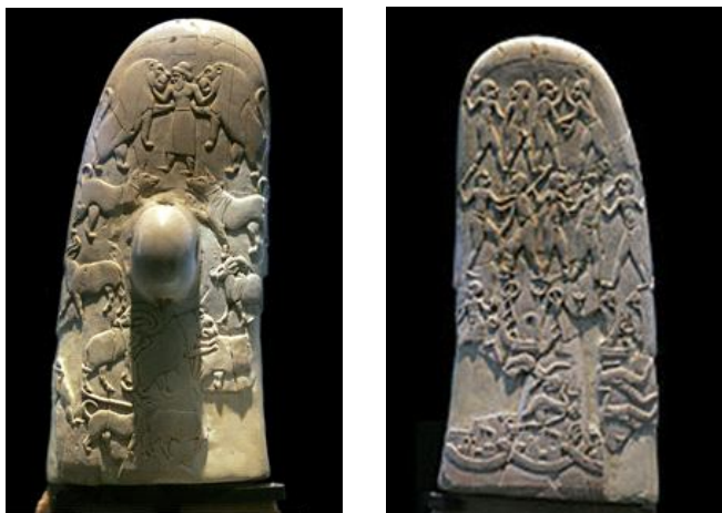
Фиг. 5. Дръжка на нож от зъб на хипопотам, Лувър, музеен номер E 11517, Линк към снимките:

Налична е аналогия между миниатюрните релефи и артефакт, открит в друга процъфтяваща цивилизация по същото време – Египет 17 . Става въпрос за изработената от зъб на хипопотам дръжка на нож (виж фиг. 5.), чиито релефи представят царя жрец между два лъва, под които са изобразени животни и ловец, а от другата страна на артефакта релефите представят в няколко регистъра сцени с борба и лодка.