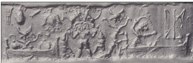
Фиг. 9. Porada 1948 B, Pl II, № 4a,

Фиг. 9. представя цилиндричен печат, в сцената на който е гравирани детайл, представляващ фигура с едно око. От хилядолетната история на Месопотамия до нас са достигнали само още два други примера за този мотив. Единият откриваме върху цилиндър от раннодинастическата епоха в Двуречието, а другият – в много по-късната релефна плоча от Хафадж 19 . Като аналогия на образа несъмнено може да съпоставим много по-късната митична древногръцка фигура на едноокия циклоп. От това сравнение мотивът в шумерските паметници е наречен по същия начин – циклоп.