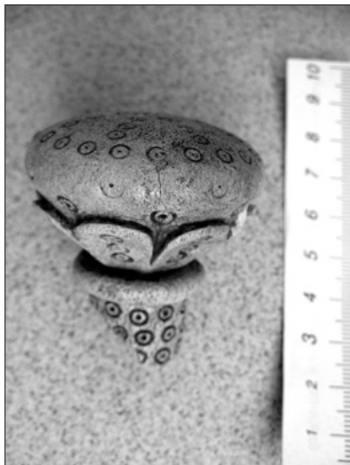
Обр. 2. Костен завършек от архиерейски жезъл.