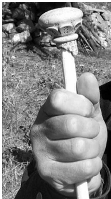
Обр. 3. Архиерейски жезъл от Трапезица (възстановка).