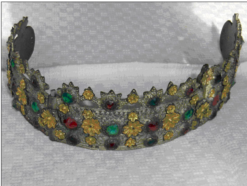
№ 4. Сребърно кръжило от сокай с позлата от XIXв. – лична колекция на Павлин Чаушев