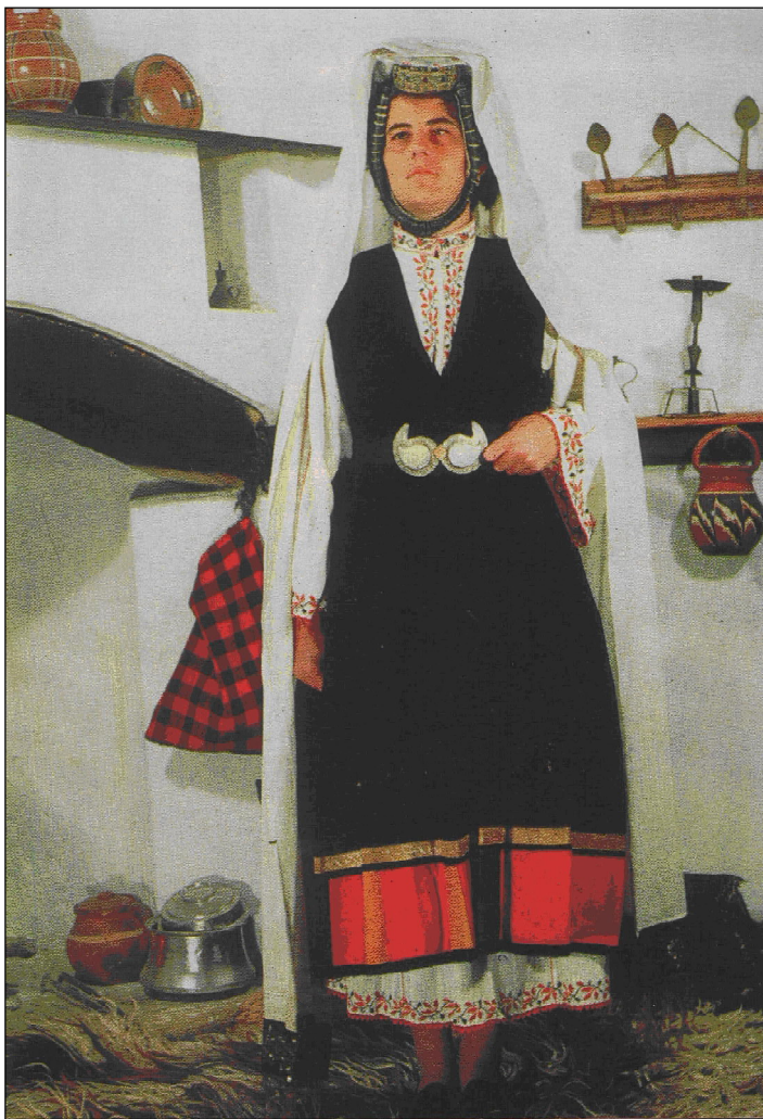
№ 3. Забраждане със сокай от с. Килифарево, Великотърновско. XIXв. (Драганова 1974)