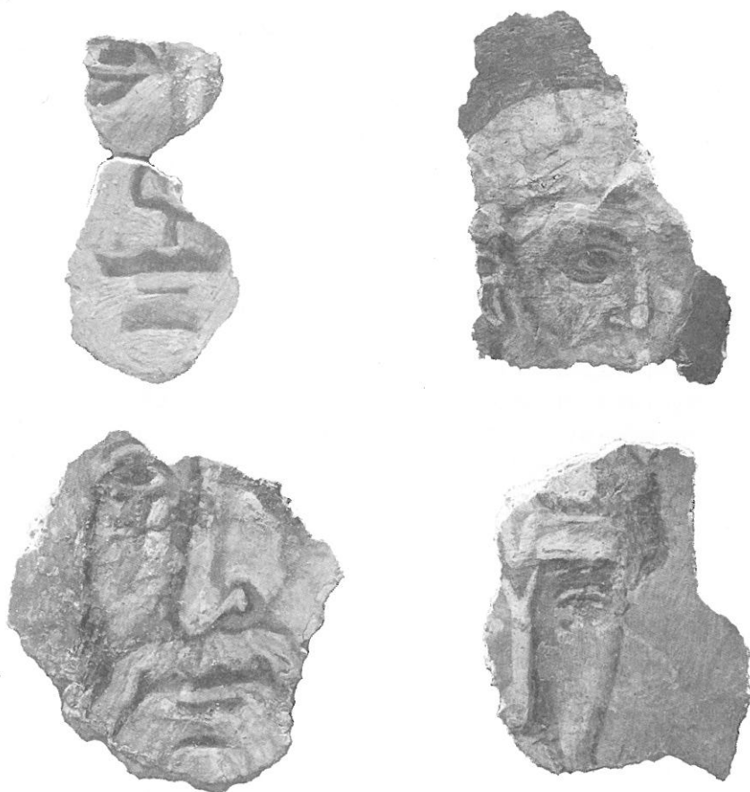
Обр. 1-4. Стенописни фрагменти с изображения на светци от разкопките на крепостта Царевец.

двореца е разкрита църква № 4, която е била стенописана 11 . Със стенописи е била и голямата, триапсидна църква № 5 с кръстополен план, която вероятно е играла ролята на кадерален храм. Значителен стенописен материал е открит при проучванията на църкви с №№ 6 и 13, като при последната броят на фрагментите е 1400 12 . На запад от дворците е разкрита еднокорабна църква № 16, с полуцилиндричен свод и петстенна апсида, която също е била стенописвана. Стенописен материал постъпва при разкопките на още две от църквите на западния склон (№№ 10 и 18). На западния склон е разкрита църква № 14 — еднокорабна, куполна с предверие и пристроен параклис, която по-късно се превръща в манастирска