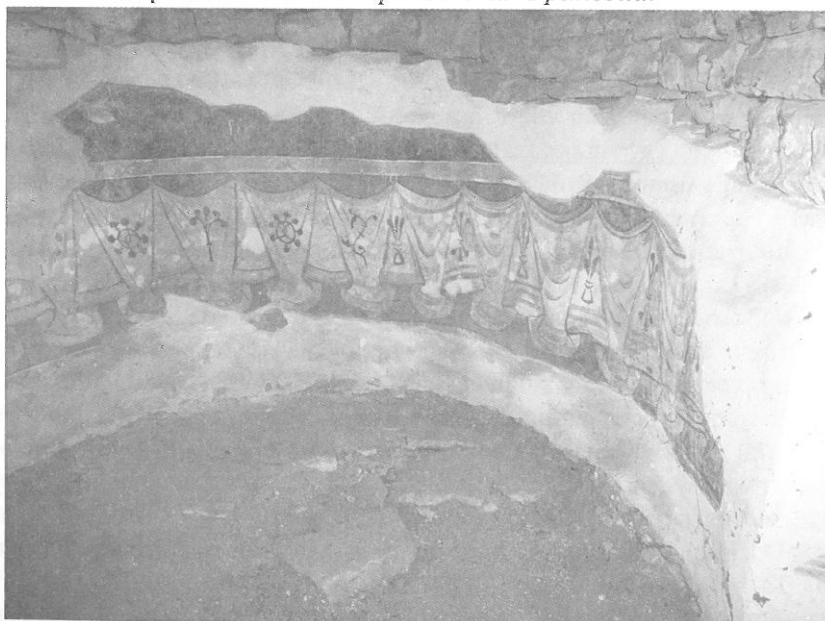
Обр. 9. Цокълна драперия от апсидата на църква № 10 на крепостта Трапезица.