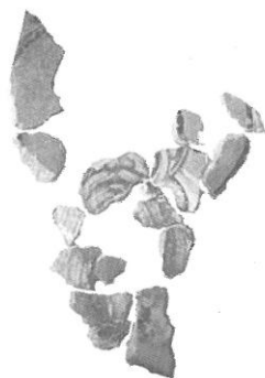
Обр. 11. Изображение на светец от църквата, южно от храма „Св. Четиридесет мъченици“ във Велико Търново.

Новоразкритата през 2007 г. от К. Тотев църква на юг от „Св. 40 мъченици“ е разположена във външния южен двор на комплекса Великата лавра. Отритите при разкопките стенописи са обработени, сортирани и сглобени, доколкото позволяват фрагментите, като живописа е датирана