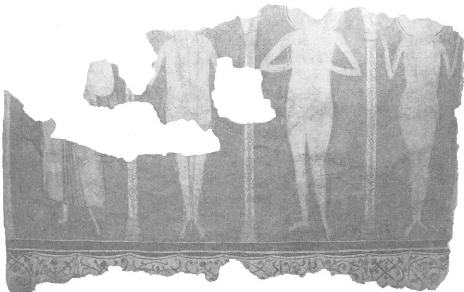
Обр. 12. Светци-анакхорети от Стария Преображенски манастир.