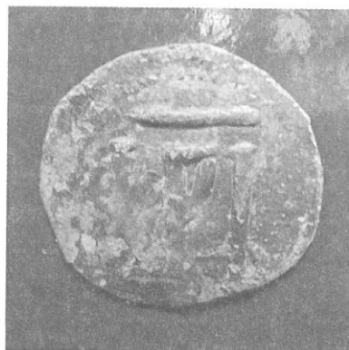
Обр. 3а, б България, Иван Шишман (1371—1393)