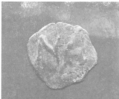
Обр. 5а, б Византия, Андроник II (1282—1320)

Савойска (1351—1354) или 2 на Андроник I (1183—1185). Налице е своеобразно отражение на политическата ситуация в България от времето на Андроник II, характеризираща се с отслабналата сила на централното българско управление и дори появата на татарин на търновския престол — Чака (1299 г.). Несигурността се компенсирала в по-сигурното парично вложение — византийската валута, в случая монетите на Андроник II (Обр. 5 а, б). Ситуацията продължила и след възцаряването на Теодор Светослав (1300—1321). Опозиционната търновска аристокрация потърсила защита на интересите си от византийския император Андроник II (1282—1320) 10 . Отзовал се. Последвали нескончаеми двустранни военни походи, войни и разорения, съответно в България и във Византия. Несъмнено при едни такива постоянни контакти, макар враждебни и с привкус на военни битки, стоката си търсела сигурния еквивалент — парите (монетите). Така, че наситеността на паричния пазар откъм монети на Андроник II се обяснява, става разбираема.