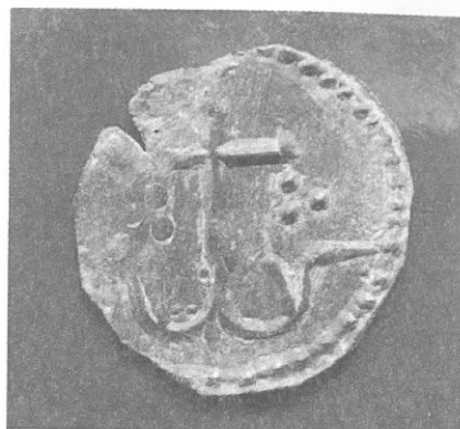
Обр. 2а, б България, Иван Александър (1331—1371)