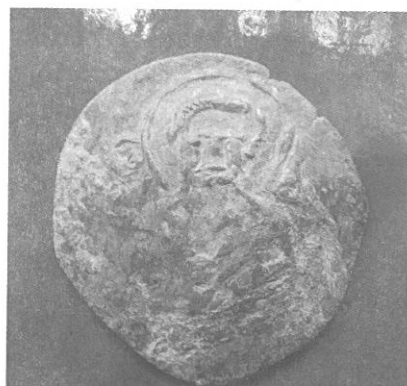
Обр. 4а, б България, Мицо Асен (1256—1257)