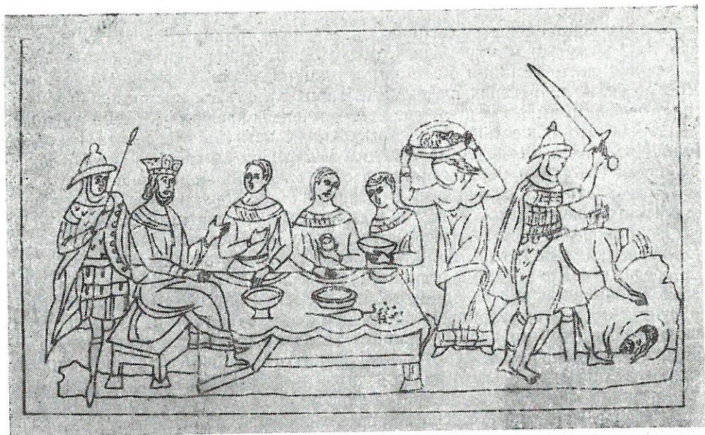
Обр. 4. „Отсичане главата на Йоан Кръстител“ — миниатюра от Томичовия псалтир (XIV в.)