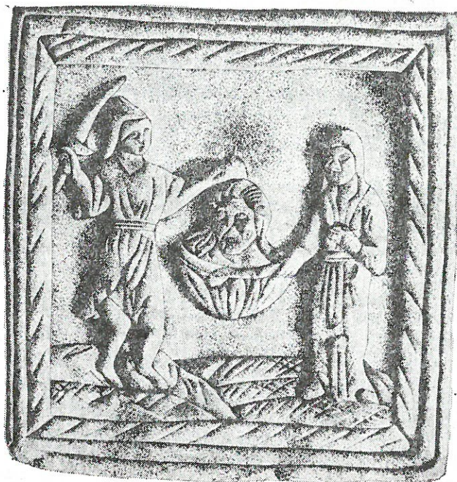
Обр. 1. „Отсичане главата на Йоан Кръстител“ — мраморна икона от с. Драганово, Великотърновско (XIV в.)

В рамките на едно съобщение е невъзможно да се направи преглед на всички прояви, свързани с култа на светеца, затова ще се ограничим с разглеждане на данните, които предлага публикуваната наскоро каменна икона от с. Драганово, Великотърновско 5 .