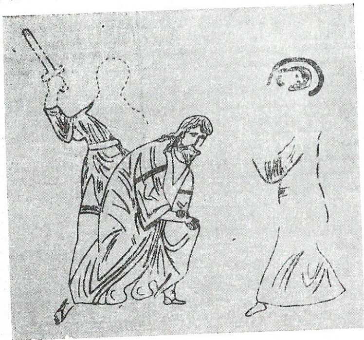
Обр. 3. „Отсичане главата на Йоан Кръстител“ — миниатюра от грузинския Синаксар — А 648 (XI в.)

ва В. Лихачова, и скрипториите в Търново през XIV в. 16 Изводът на съветската изкуствоведка за скрипториите в българската столица е важен за разглежданата житийна икона от с. Драганово, Великотърновско, тъй като нейният автор би могъл да се ползува от изображения върху някои от стигна-