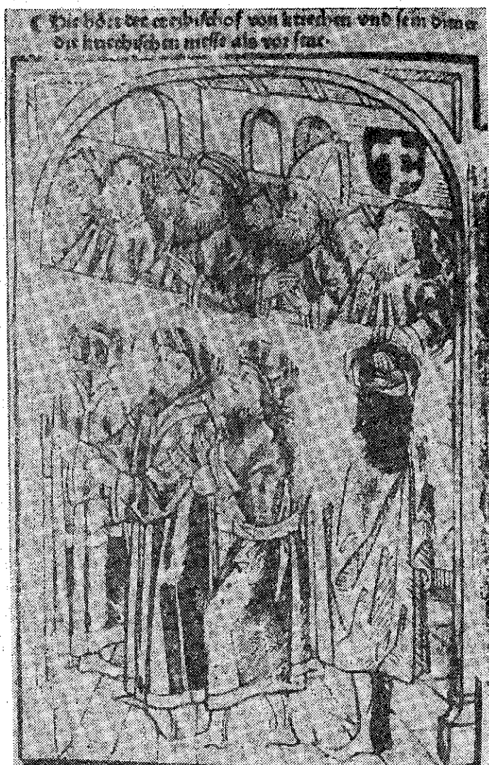
Фиг. 2. Григорий Цамблак присъствува на литургия под щита на своя герб. Рисуна в Аугсбургското издание на „Хроника на Констанцкия събор“ от 1483 г.

героите му, а обществената активност. Макар и ослепен, според Григорий Цамблак Стефан Дечански побеждава Варлаам, който избягал от Италия, строи манастир, създава приют за стари и болни монаси, стреми се да бъде добър владетел — „цар на великия преславен сръбски народ, който не само превъзхожда другите [владетели] с военната си сила и слава, но ги надминава с богатството си, с красивото местоположение и величие, но и с царе най-благочестиви и премъдри. . .“ (§ 1/1).