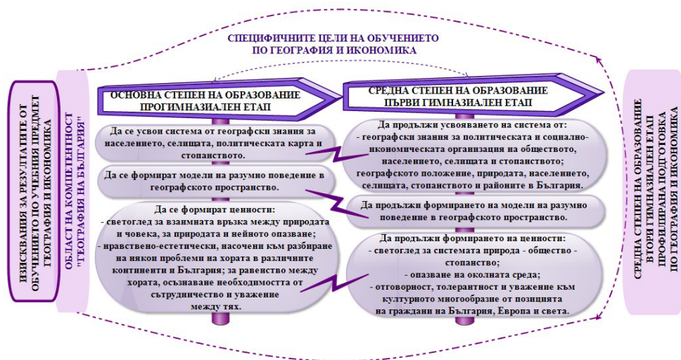
Обр. 2. Обобщен модел на специфичните цели по ДОС, обвързани с обекта и предмета на етнологията по област на компетентност „География на България“ – население и селища

В специфичните цели на обучението по география и икономика на ДОС са детерминирани и присъстват цели за знания, умения и компетенции, които експлицитно и имплицитно съдържат обекта и предмета на етнологията (Обр. 2).