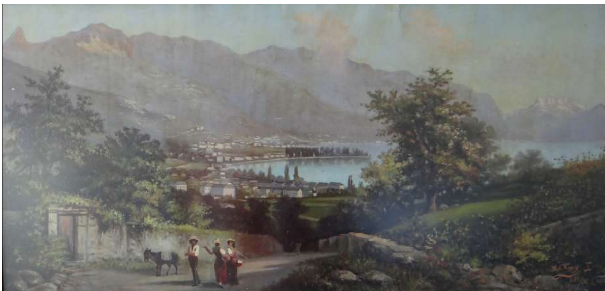
Ил. 6. „Италиански пейзаж“ 1889–1890г., м. б. картон, 33x68см., автор: Христо Кутев. Собственост на ХГ „Христо Цокев“, Габрово