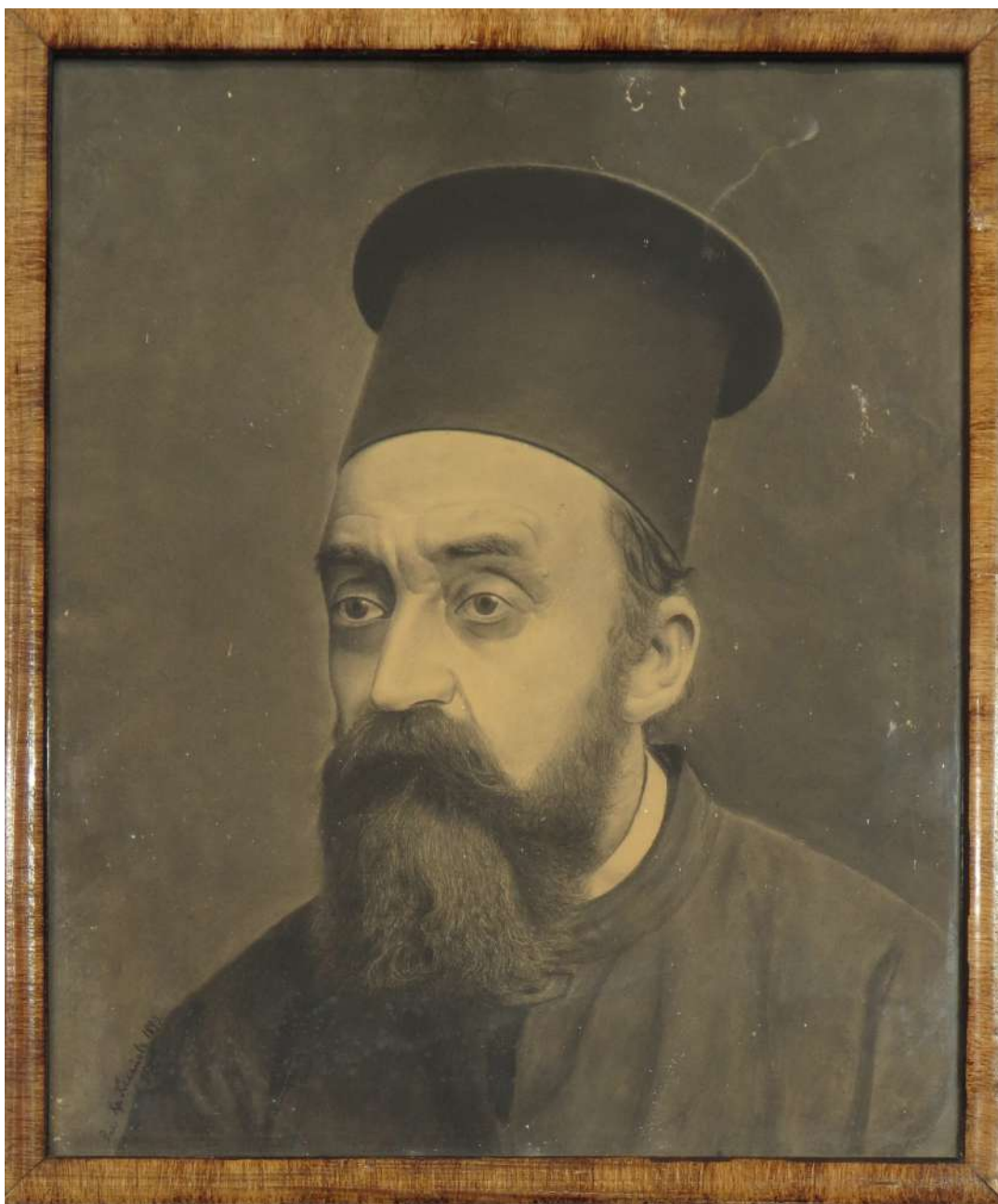
Ил. 5. „Портрет на свещеника Васил Михов“, молив, хартия; 52x42см., автор: Христо Кехайов. Собственост на Регионален исторически музей – Габрово.