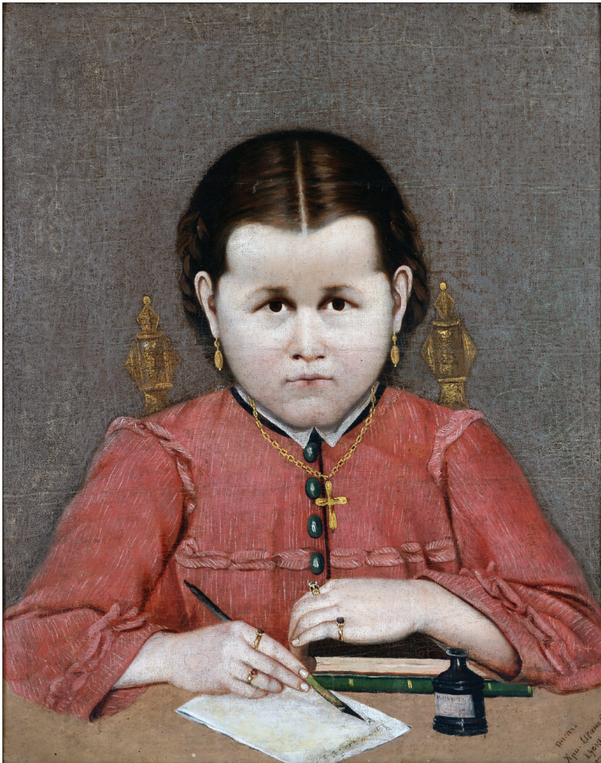
Ил. 3. „Портрет на момиче“ 1874 г., м. б. пл., 61x49см., автор: Христо Цокев. Собственост на ХГ „Христо Цокев“, Габрово.