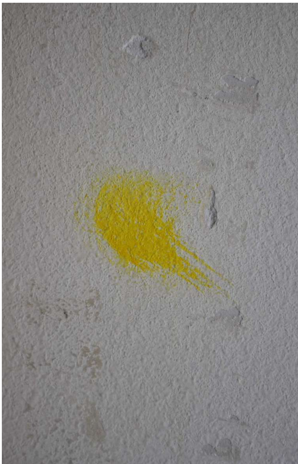
4. Антон Вълев, дигитална фотография, дигитален печат върху фолио, 2021