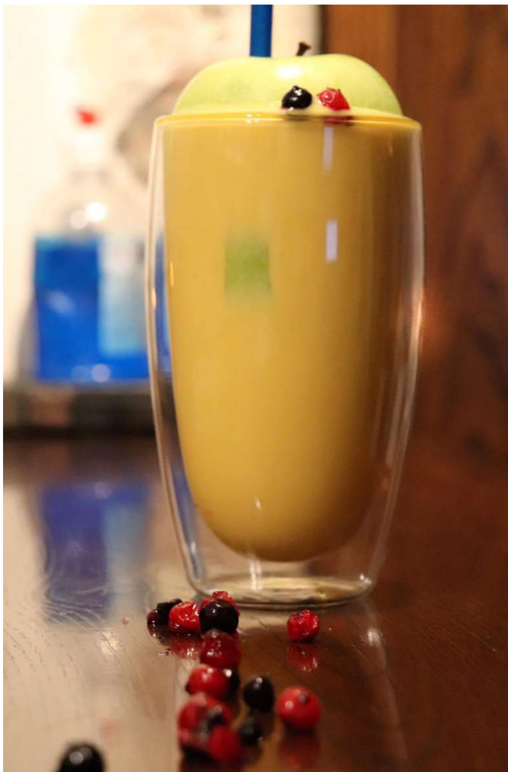
3. Георги Узунов, дигитална фотография, дигитален печат върху фолио, 2021