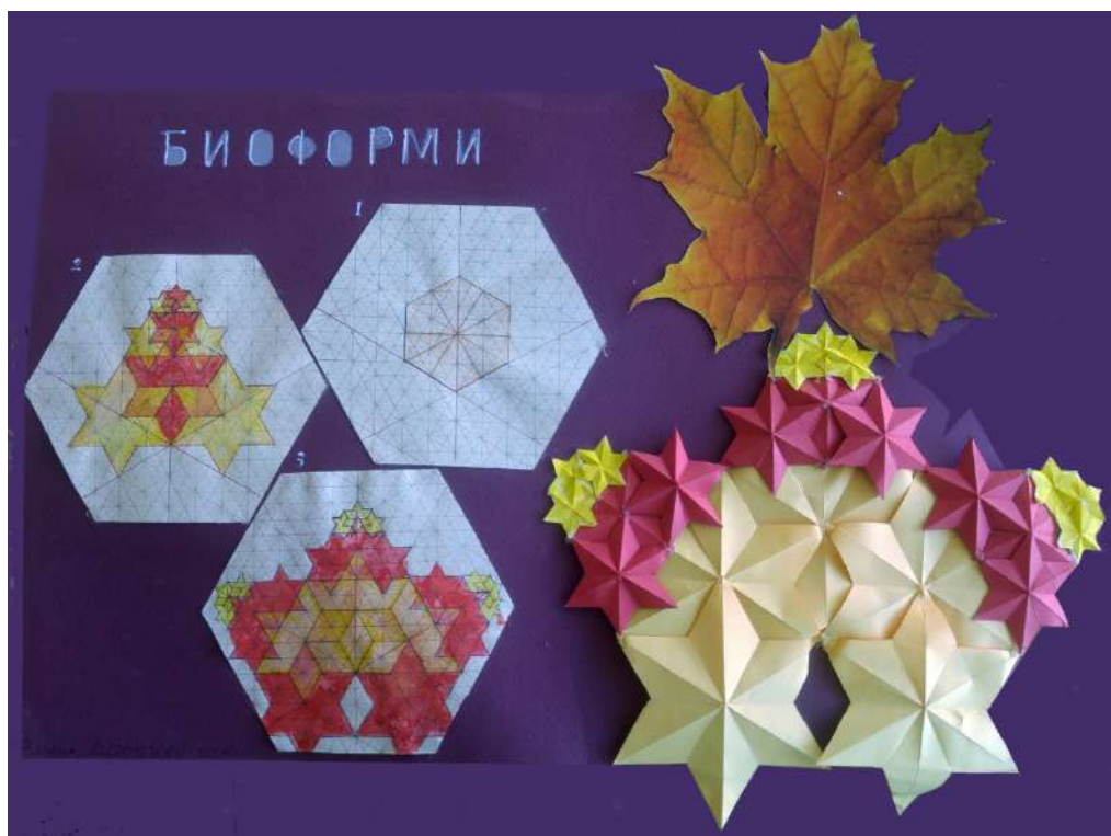
Ил. 2. резултат от упражнения – специалност „Архитектура“ в УАСГ

Приложение към: Илко Николчев. Организация на формата чрез морфологичен анализ на природни обекти Supplements to: Ilko Nikolchev. Organization of the Form Through Morphological Analysis of Natural Objects