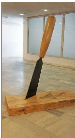
Марио Конов „Сътворение“