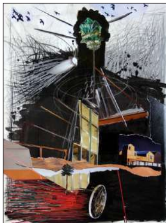
Слободан Радойкович, „Дървото на живота утре“