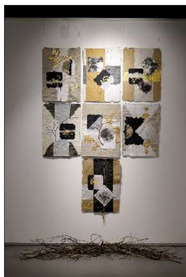
Красимира Дренска „Родословно дърво“