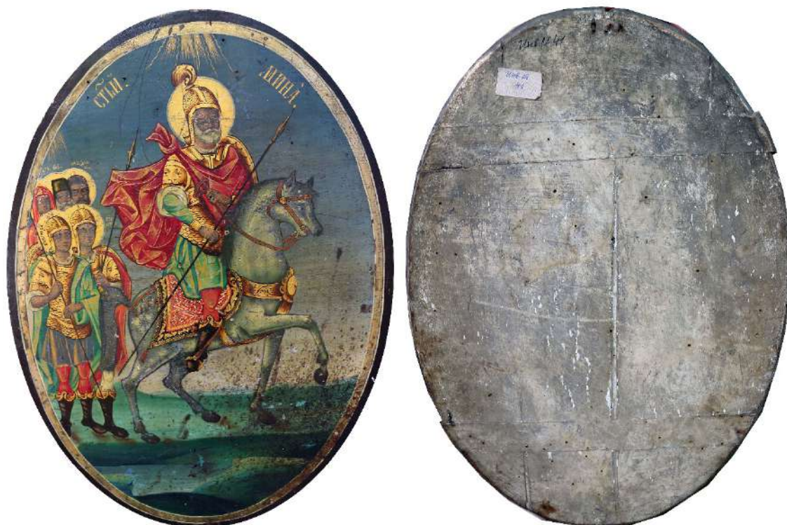
Фиг. 1. „Св. Мина с избрани светии“, икона, Никола Василев, дърво/платно, масло, 55x39 см., 1869 г., Къща-музей „Добри Войников“, Шумен

по тях. Тази теза е изградена въз основа на надписа на гърба на една икона „Св. Мина с избрани светии“, подписана от Никола Василев, за който твърдя, че демонстрира личния почерк на иконописеца. Твърдението е подкрепено чрез сравнителен анализ с един ръкописен надпис (Фиг. 4.) върху гърба на друга негова икона „Св. Николай“ (Фиг. 3.), която макар и неподписана, е безспорно атрибутирана по стилистични признаци, а сега вече и чрез съпадението на почерка на двете моливни бележки.