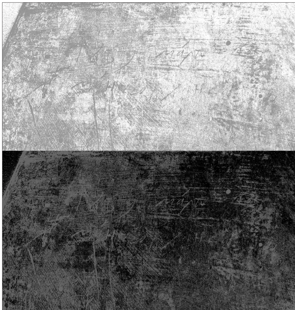
Фиг. 2 „Св. Мина с избрани светии“, гръб (детайл)

ните дейности заради грандиозните грешки и поправки на конструкцията, както и за спирането му заради настъпването на 10 ноември 1989 г. Това съоръжение, което и днес продължава да загрозява центъра на Шумен, през 1987 г. остави стотици шуменски семейства без красивите им родни къщи, заменени с панелни апартаменти в крайните квартали. Много от тях разпродават покъщнината, която не може да бъде пренесена в по-малките нови жилища и част от вещите им с историческа стойност попълват музейните фондове на Шумен. Същата е била съдбата на дома на ул. „Илия Р. Блъсков“ № 4, а заедно с неговото изчезване са се заличили и следите на семейство Пеневи, които евентуално биха могли да пазят спомени за поръчителя на разглежданата икона. Всички тези детайли водят до заключението, че най-вероятно иконата „Св. Мина с избрани светии“ е станала част от експозицията на къщата-музей „Добри Войников“ през 1987 г.