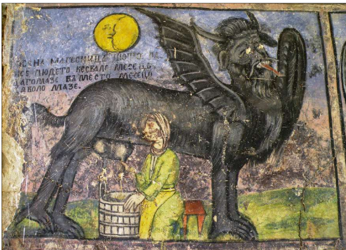
8. Магесницата дои дявола, вместо свалената луна. Църквата Св. Архангел Михаил в с. Лешко