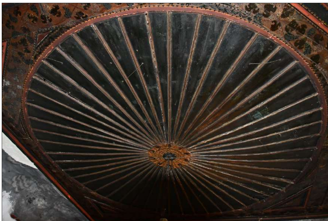
1. Розета в центъра на изображение на слънце от свода на църквата Св. Никола в с. Гайтаниново

Supplements to: Vasil Markov. The Sky, Sun, Moon and Stars in The Renaissance Churches Wood Carving from Southwestern Bulgaria (Semantic aspects)