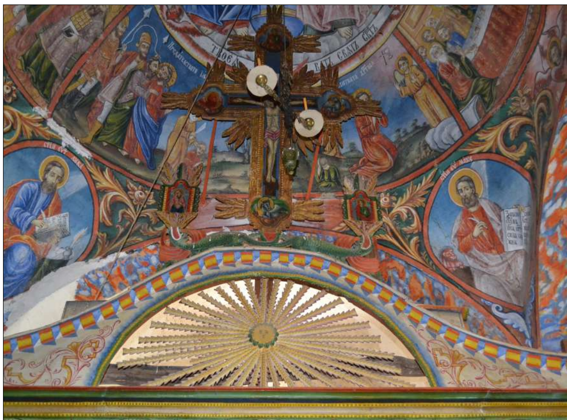
5. Изображение на слънце с човешко лице. Ц. Св. Йоан Предтеча в с. Бистрица