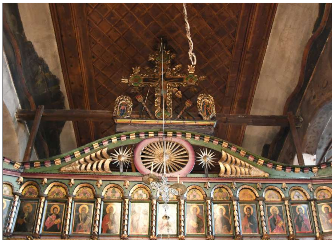
2. Изображение на три слънца от иконостаса на ц. Св. Безсребърници в Сандански