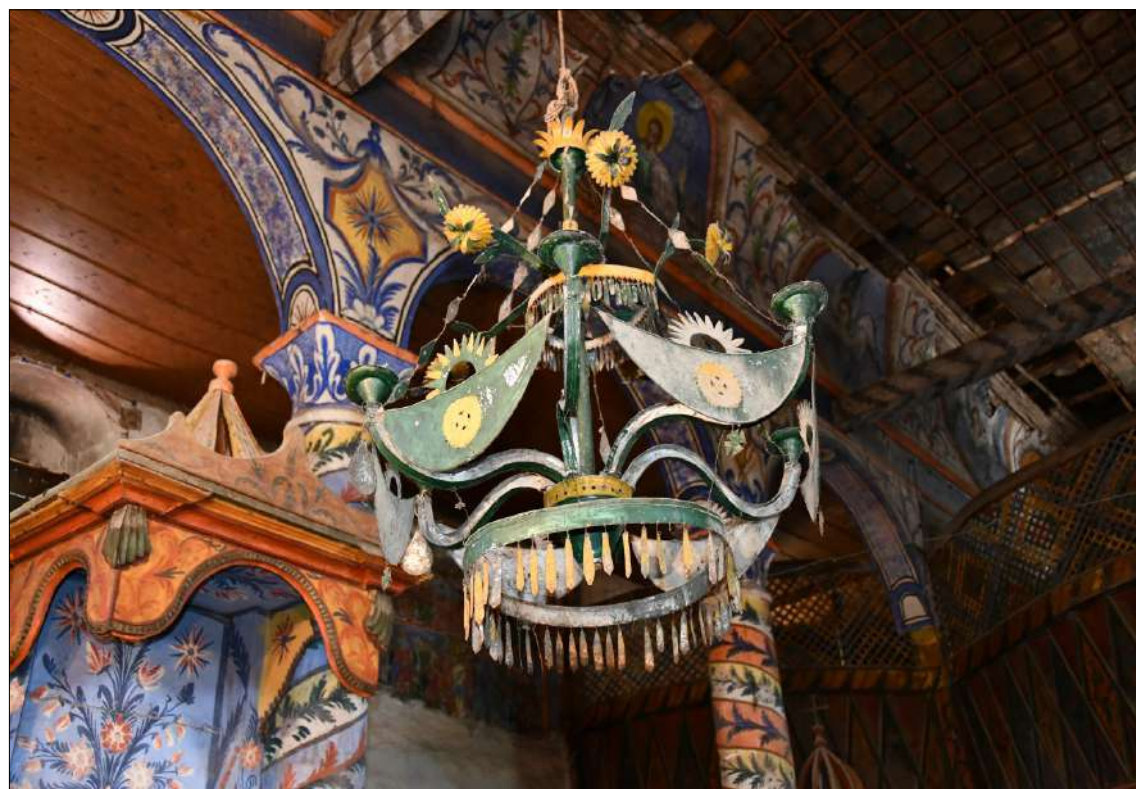
7. Светилник с лунарни символи. Църквата Св. Илия в с. Градево