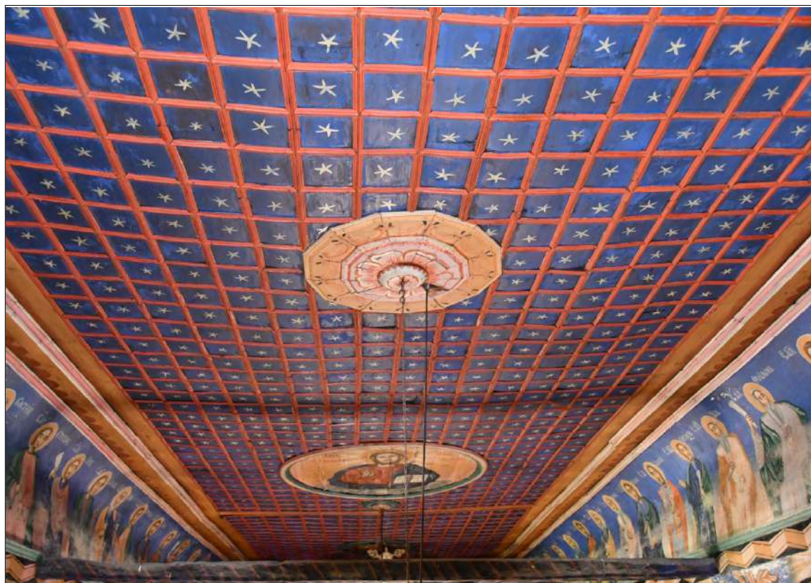
6. Небосвода със звездите и слънце. Църквата Св. Димитър в с. Палат