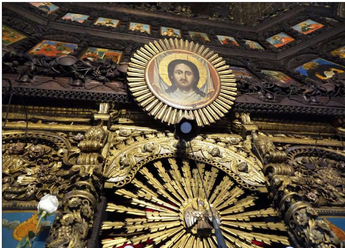
4. Христос Убрус и Св. Дух, като гълъб, в центъра на слънчево изображение. Ц. Въведение Богородично, Благоевград