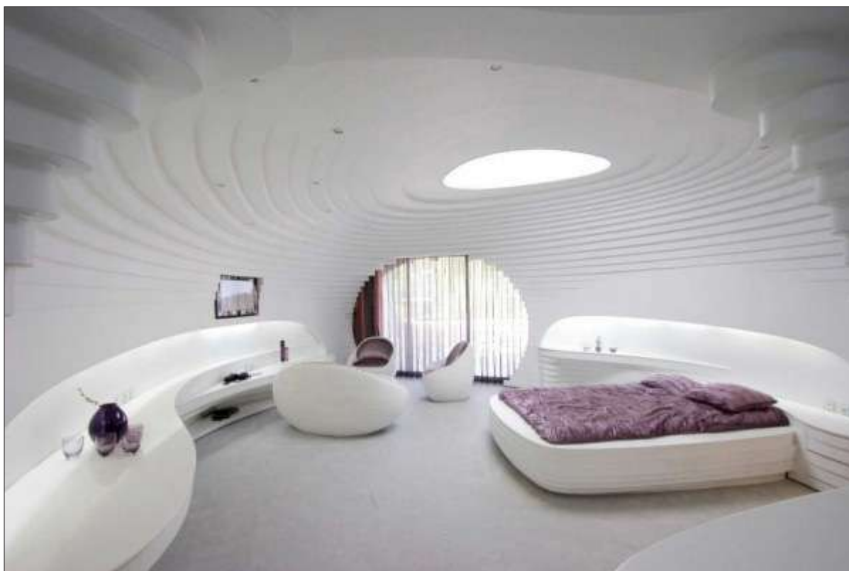
Фиг. 5. Интериор на Ски хотел Барин в Шемшиак, Иран.