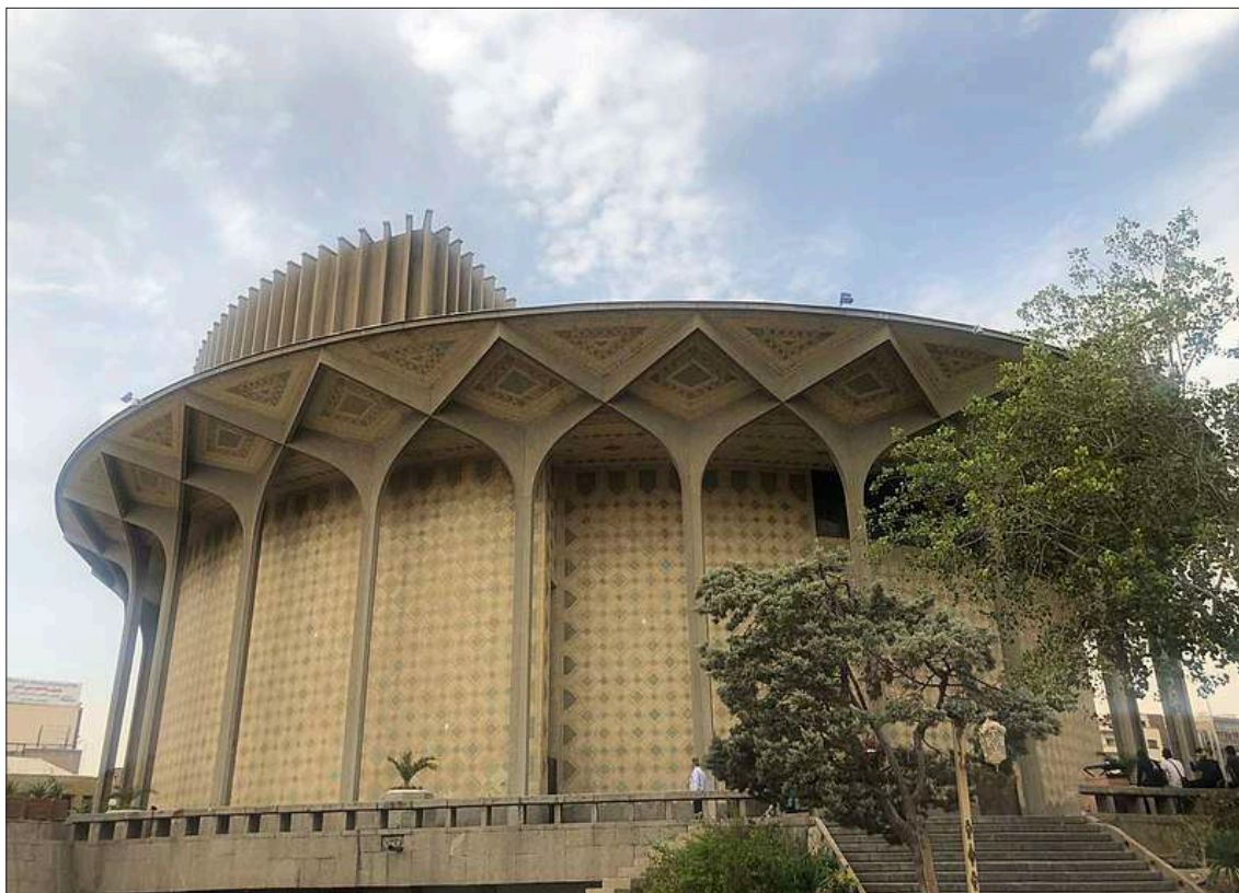
Фиг. 4. Градски театър на Техеран, Източник: Wikimedia Commons . https://upload.wikimedia.org/wikipedia/commons/thumb/e/e4/City_Theater_of_Tehran_2019_4.jpg/800px-City_Theater_of_Tehran_2019_4.jpg