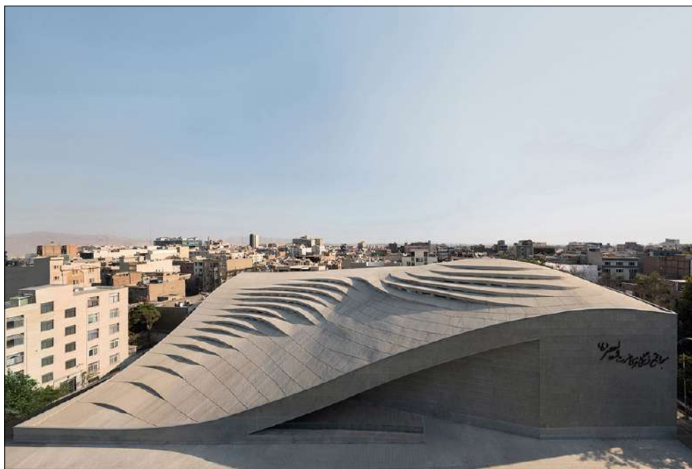
Фиг. 2. Изглед към джамията Вали-Ес-Ар, Vali-e-Asr Mosque , Източник: Wikimedia Commons . https://upload.wikimedia.org/wikipedia/commons/c/c8/Vali-e-Asr_Mosque.jpg