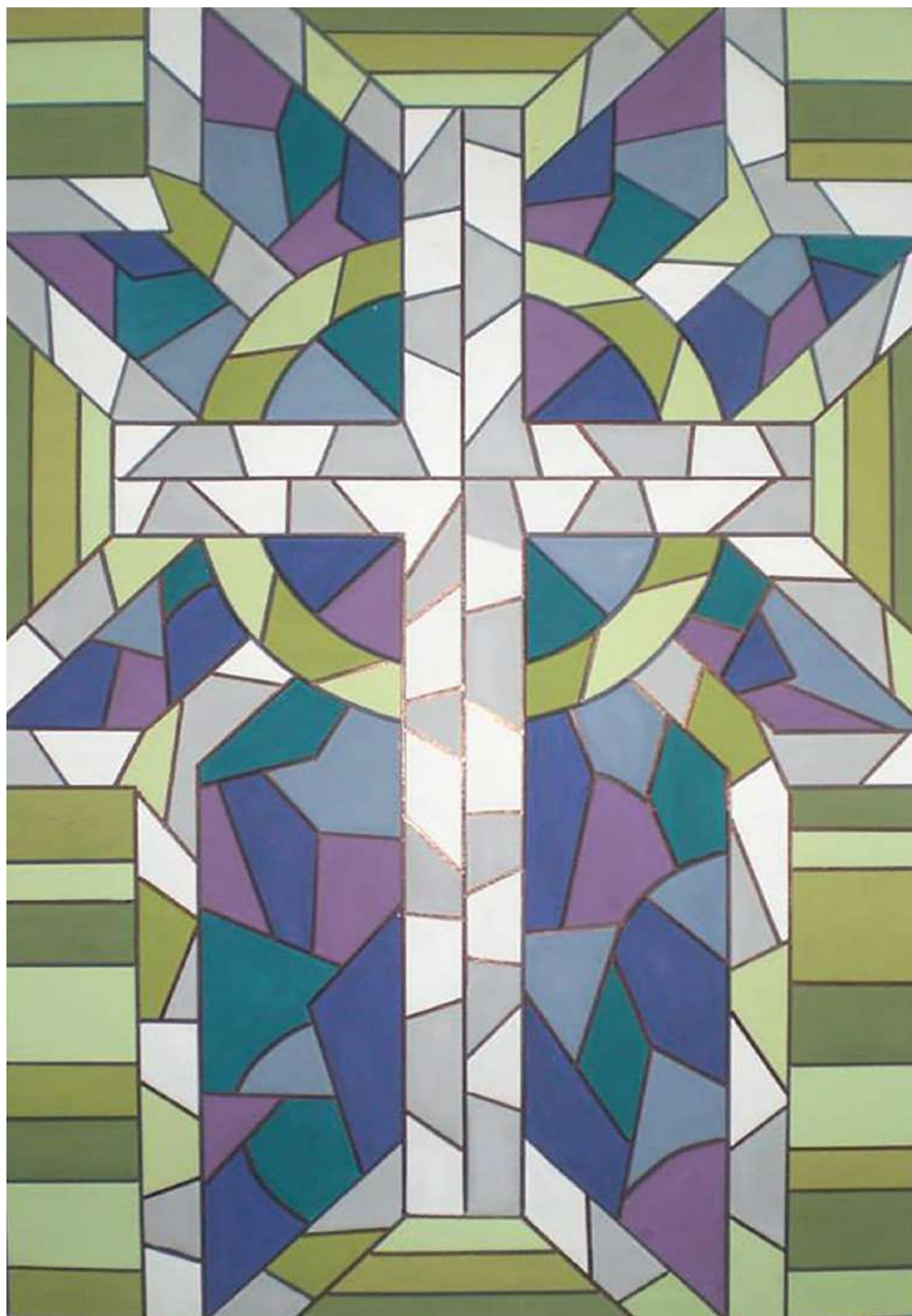
Ил. 6. Проект за витраж, 2013, автор: Ивайло Ексаров, архив: катедра „Църковни изкуства“, ПБФ, ВТУ