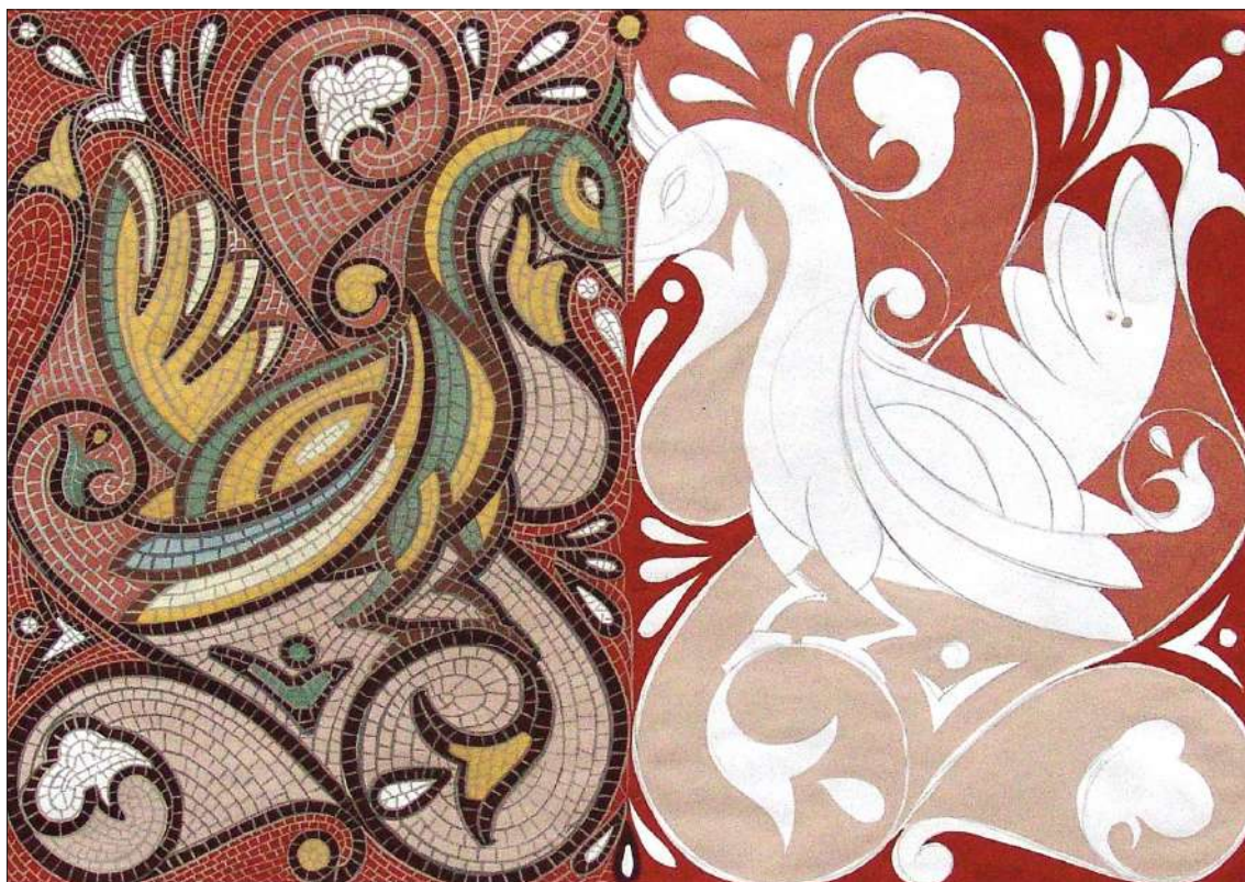
Ил. 7. Стилизирана птица, 2007, автор: Ивелина Петкова, архив: катедра „Църковни изкуства“, ПБФ, ВТУ