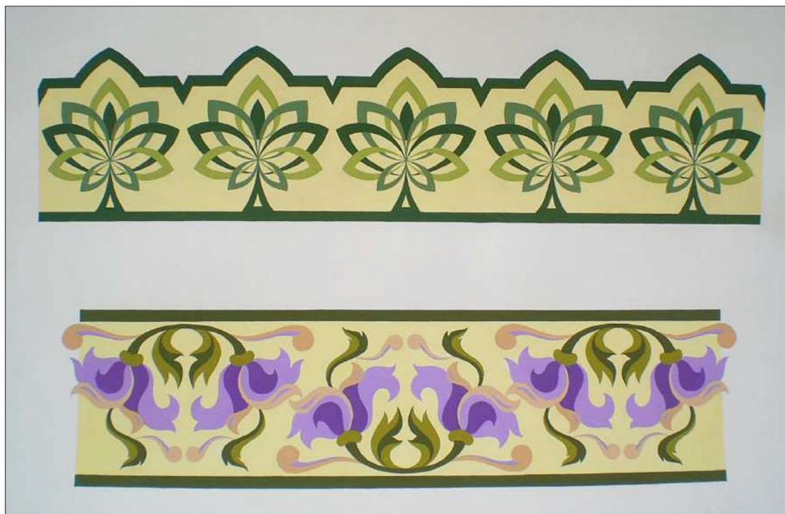
Ил. 2. Фризиви композиции, 2010, автор: Искра Кръстева, архив: катедра „Църковни изкуства“, ПБФ, ВТУ