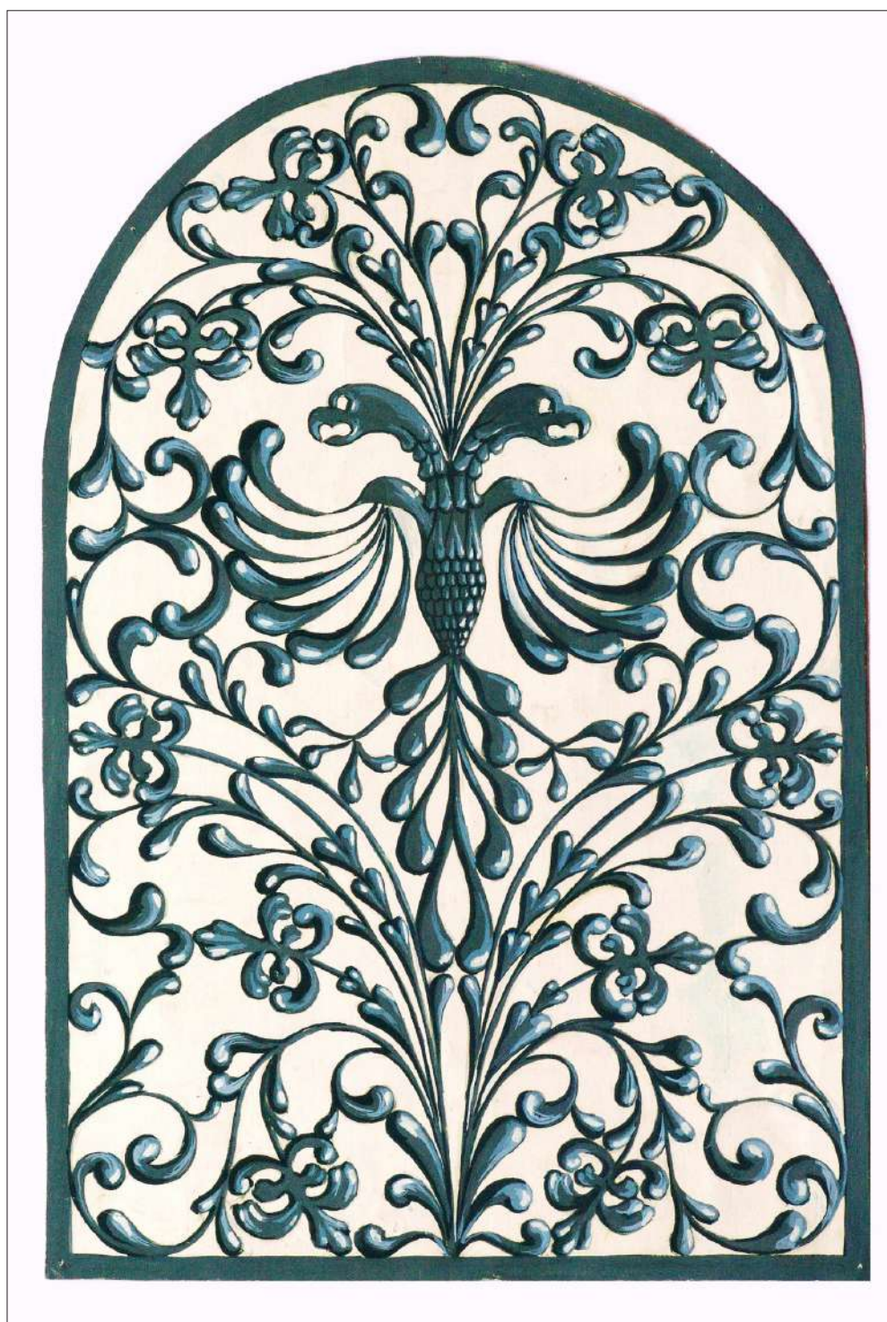
Ил. 8. Проект за метална решетка, 1995, автор: Десислава Иванова, архив: катедра „Църковни изкуства“, ПБФ, ВТУ