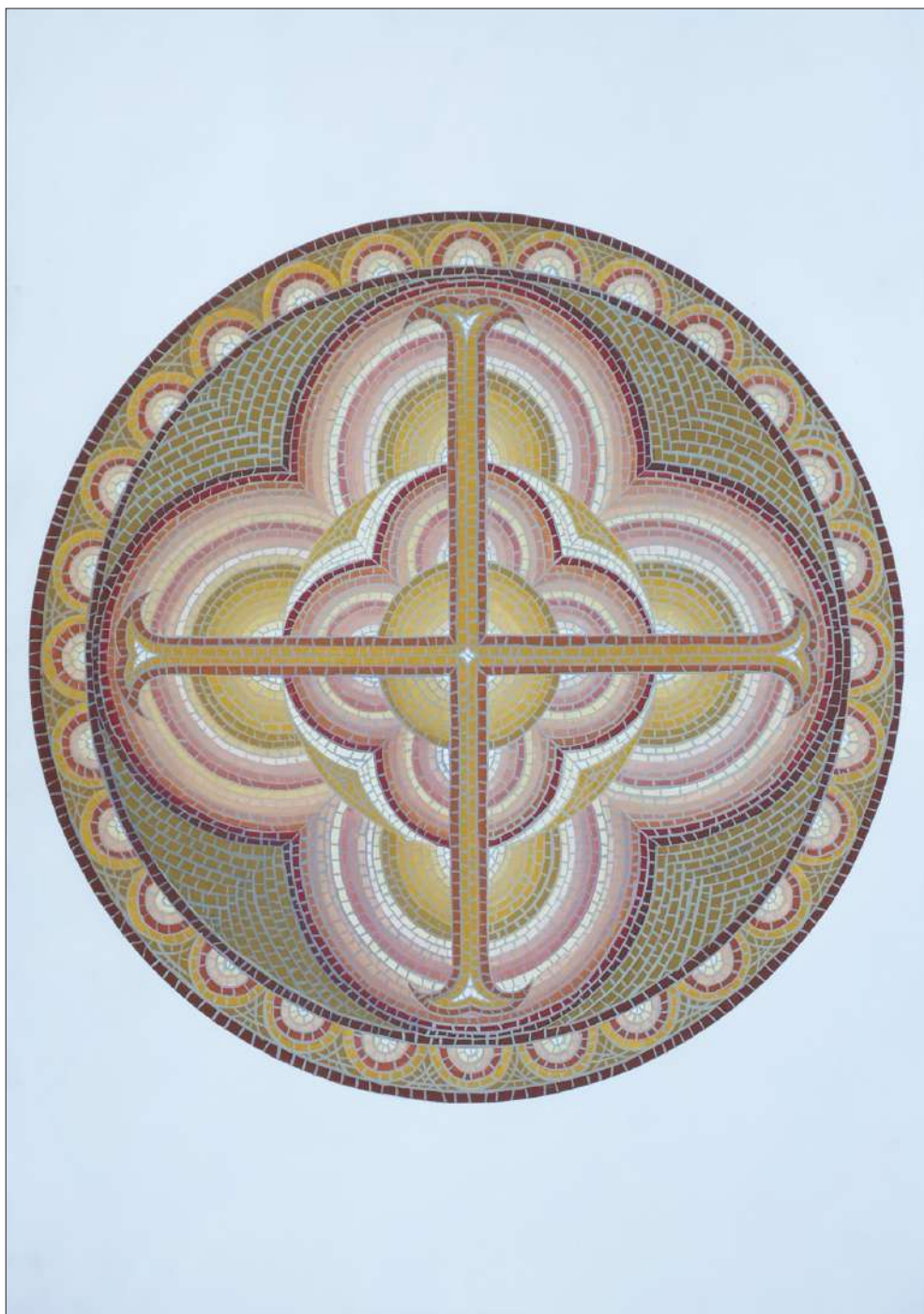
Ил. 3. Проект за мозайка, 2015, автор: Ивайло Цветков