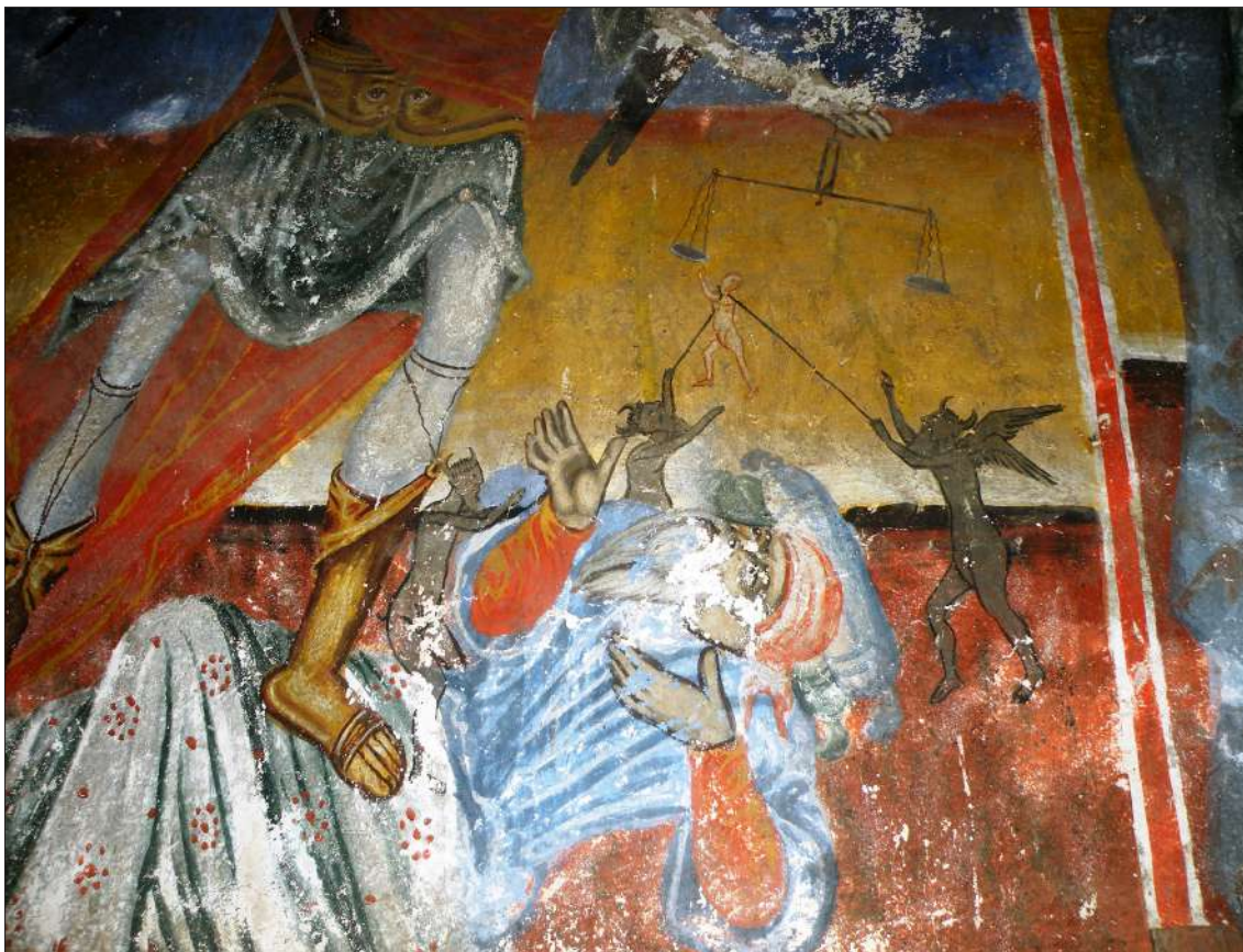
Обр. 8. Стенопис от ц. „Св. Илия“ в с. Богородица