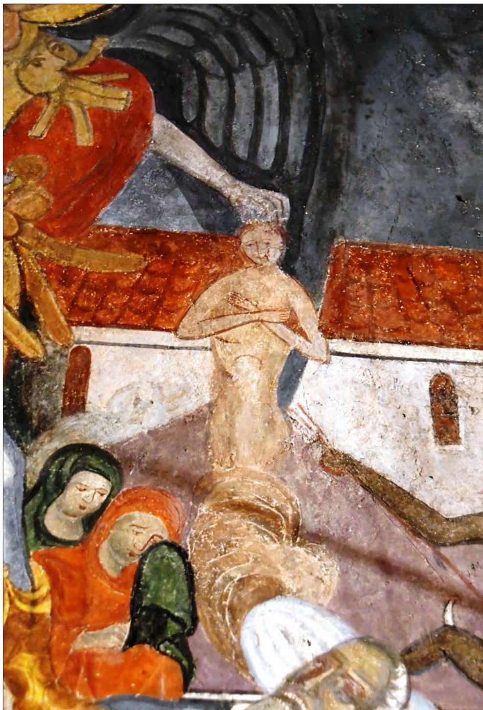
Обр. 9. Стенопис от ц. „Усп. Богородично“ в с. Кашина