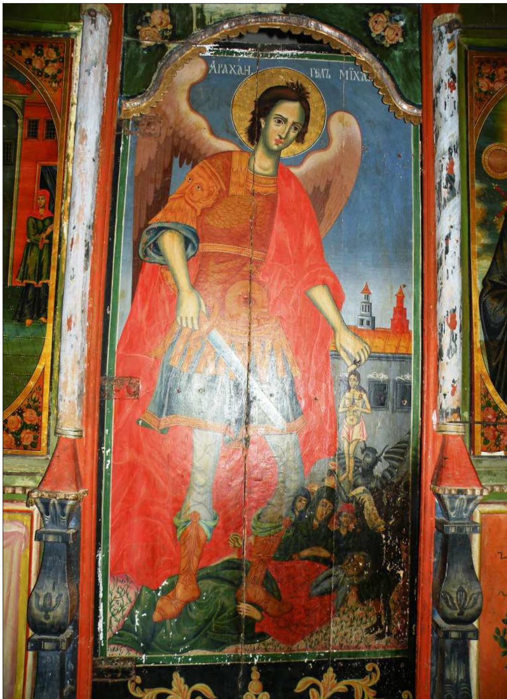
Обр. 6. Северната врата на Чуриловския манастир „Св. Георги“