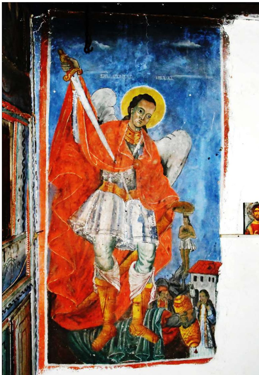
Обр. 7. Стенопис от ц. „Св. Илия“ в с. Сугарево