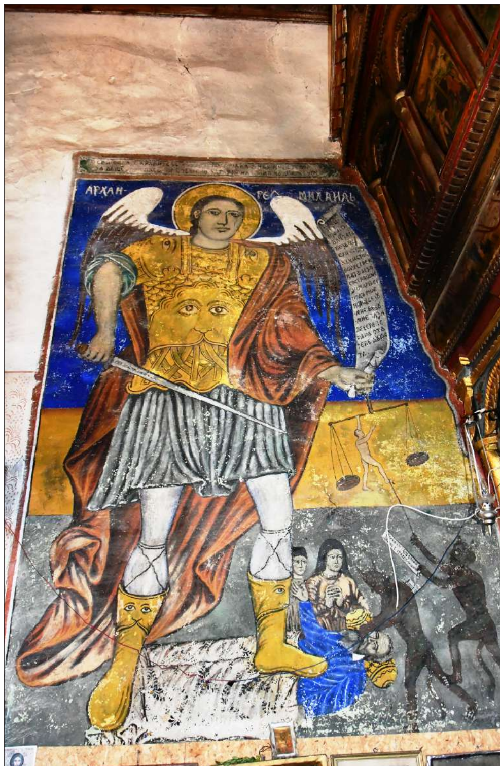
Обр. 5. Стенопис от ц. „Св. Георги“ в с. Спатово