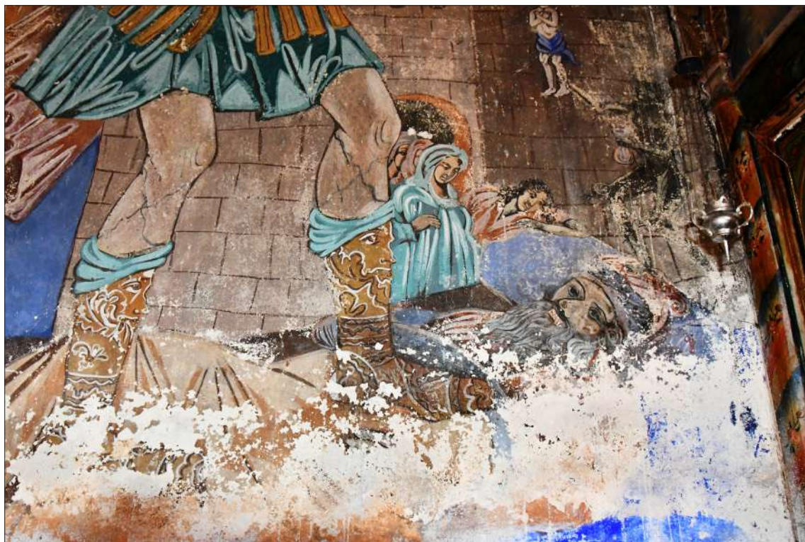
Обр. 10. Детайл от стенописа в ц. „Всях Светих“ на с. Пиперица