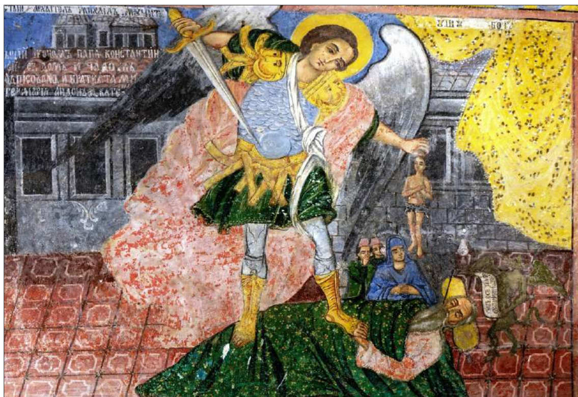
Обр. 1. Стенопис от ц. „Въвед. Богородично“ в град Благоевград

Приложение към: Жана Пенчева. Композицията „Архангел Михаил взема душата на богатия“ в иконографската програма на храмовете от Югозападна България Supplements to: Zhana Pencheva. The Composition “Archangel Michael Takes the Soul of the Rich” in the Iconographic Program of the Temples from Southwestern Bulgaria