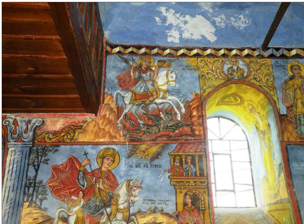
Обр. 3. Стенопис от ц. „Св. арх. Михаил“ в с. Логодаж