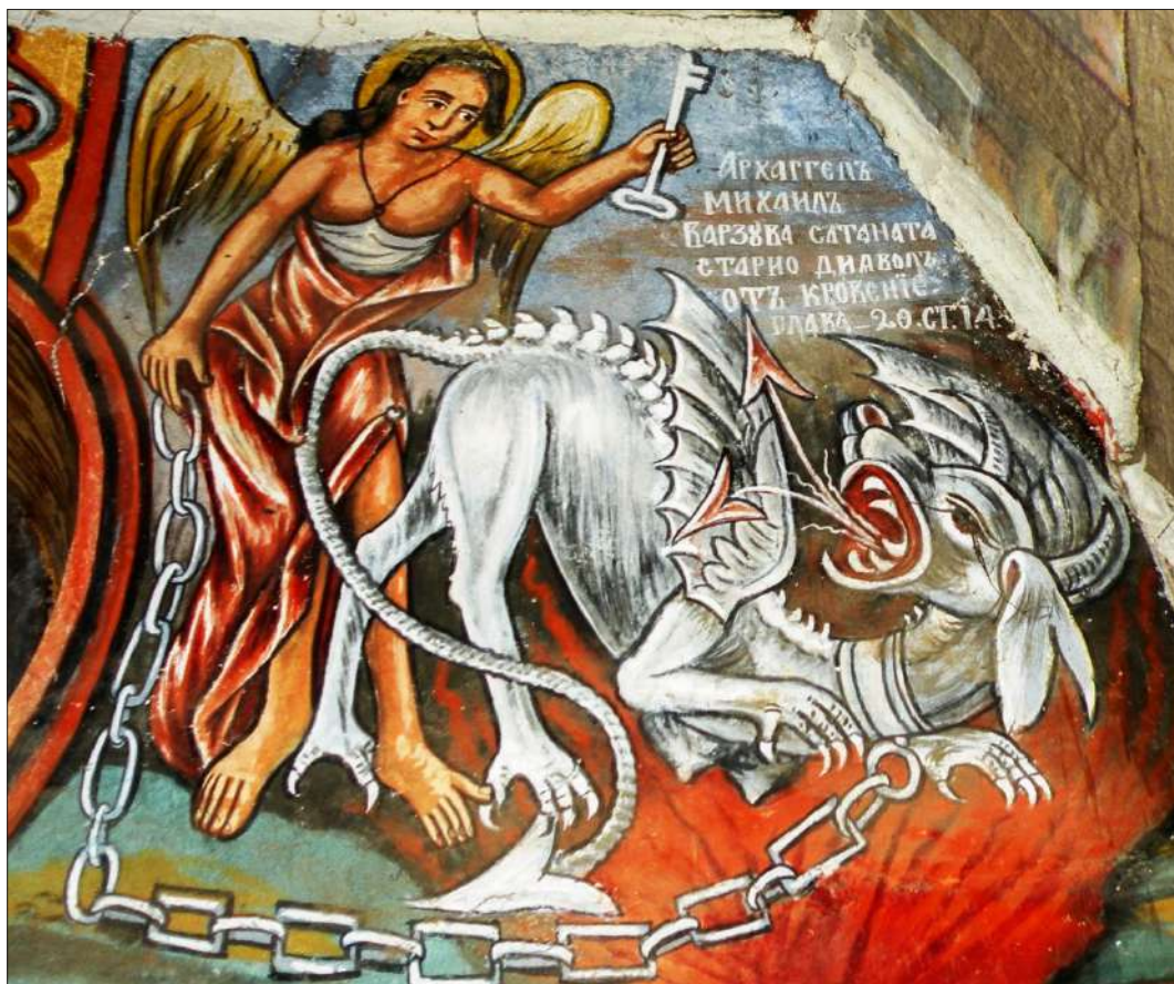
Обр. 2. Стенопис от ц. „Св. Димитър“ в с. Марулево