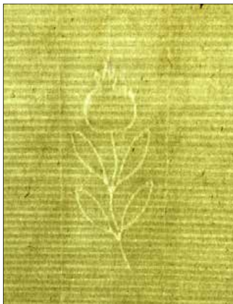
Изображение 4 Б. Филигран с флорален мотив