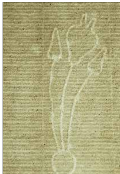
Изображение 4 А. Филигран на нар