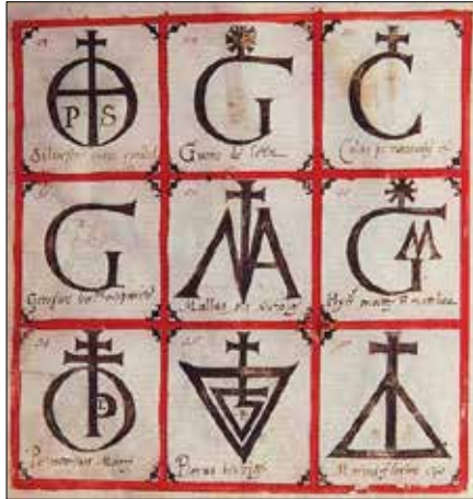
Изображение 1. Марки на вълнопроизводителите от Фабриано (1559 г.), Общински исторически архив, Фабриано, Италия