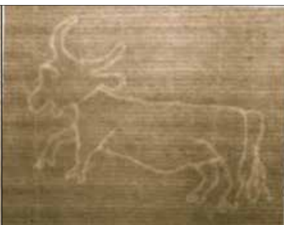
Изображения 4 В, 4 Г. Филигранни изображения на котва и бик