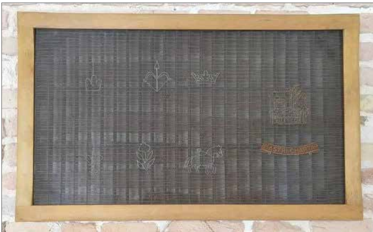
Изображение 4 Ж. Пример за различни филигранни знаци