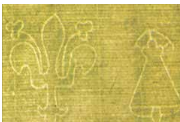
Изображения 4 Д.