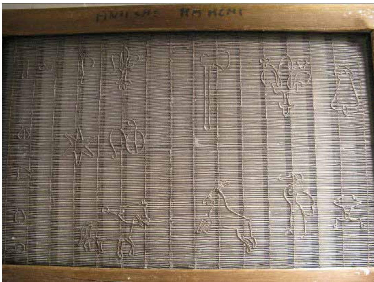
Изображение 4 З. Пример за различни филигранни знаци