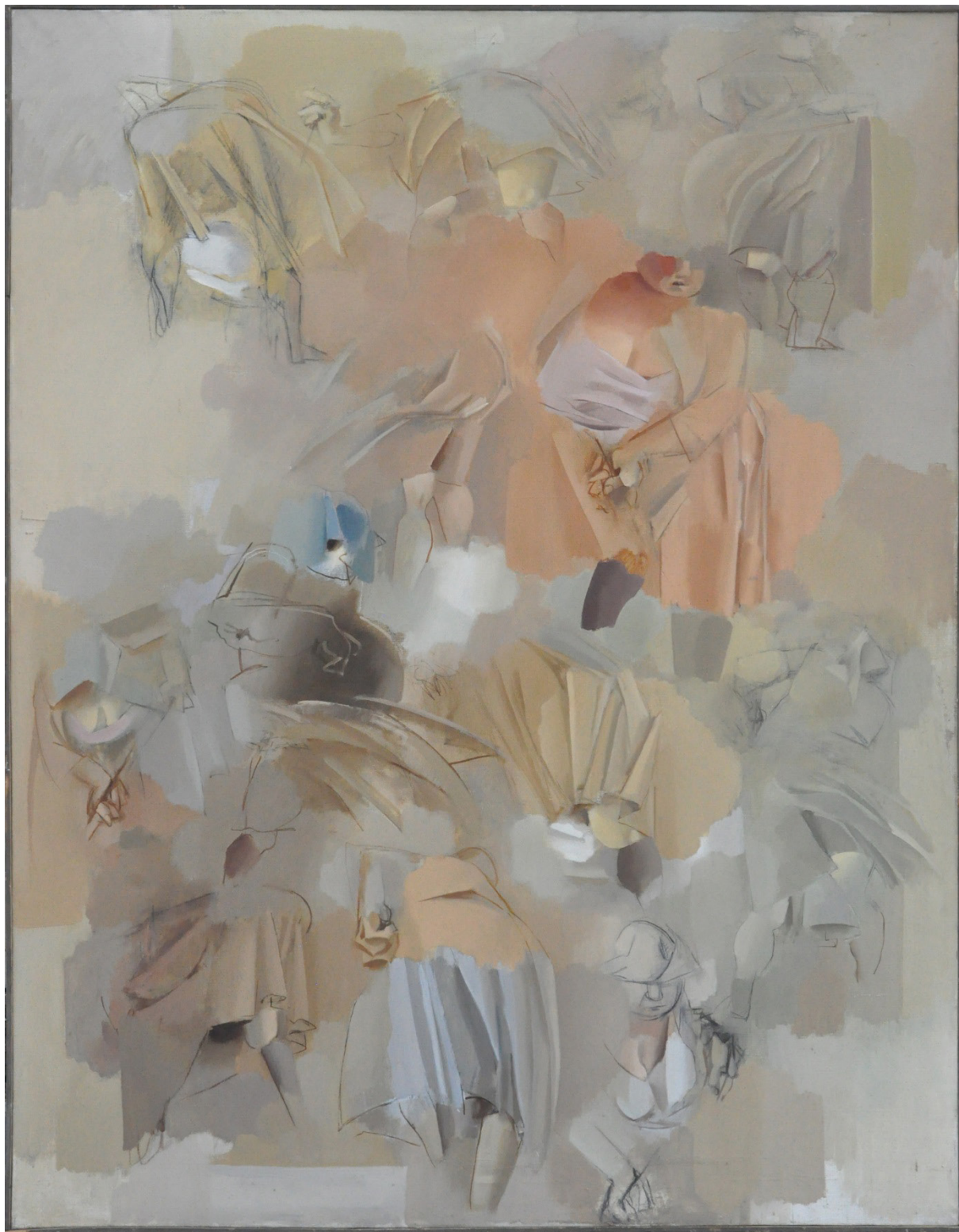
7. Анета Дръгушану. Зноен ден. (м.б. платно. 132x174см.), ХГ „Никола Петров“, гр. Видин