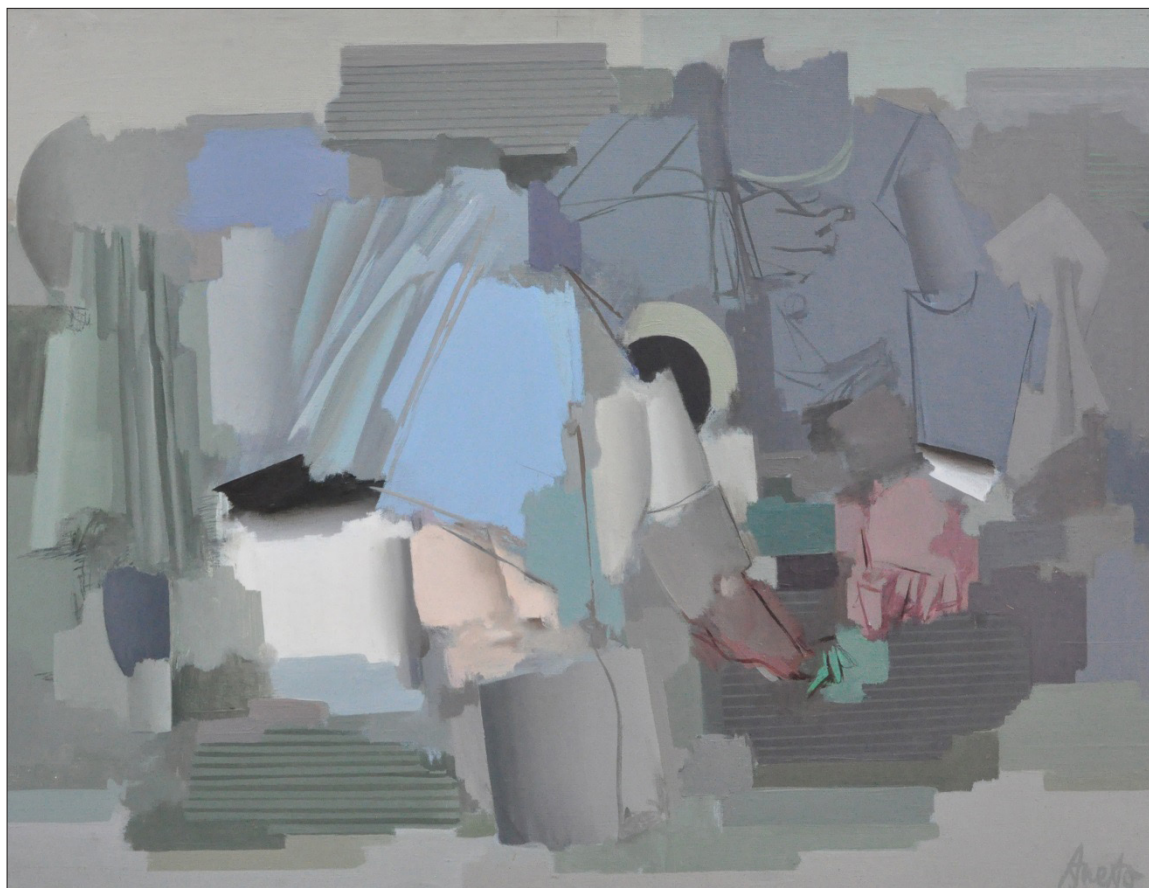
5. Анета Дръгушану. Градината на човека. 1994 г. (м.б. платно 80x60см.). ХГ „Никола Петров“, гр. Видин