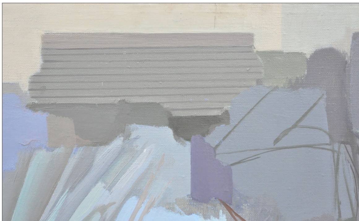
6. Анета Дръгушану. Градината на човека. 1994 г. – детайл (м.б. платно 80x60см.). ХГ „Никола Петров“, гр. Видин