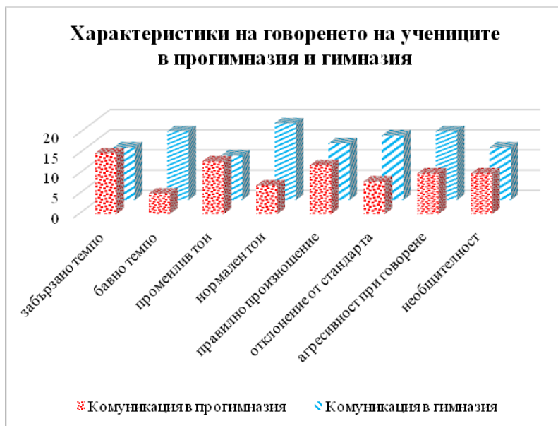
Фиг. 4. Изображение на характеристиките на говоренето при прогимназистите и гимназистите