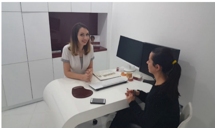
Фиг. 1. Разговор за здраве на младежи от гр. Варна

Как говорят младежите? За да се отговори на този въпрос, са осъществени записи на разговор между младежи, които обсъждат темата – колко често боледуват и ходят ли на лекар.