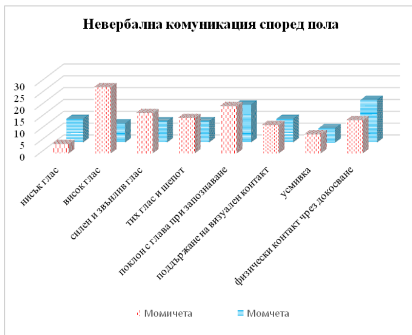
Фиг. 5. Изображение на невербалната комуникация при момичетата и момчетата