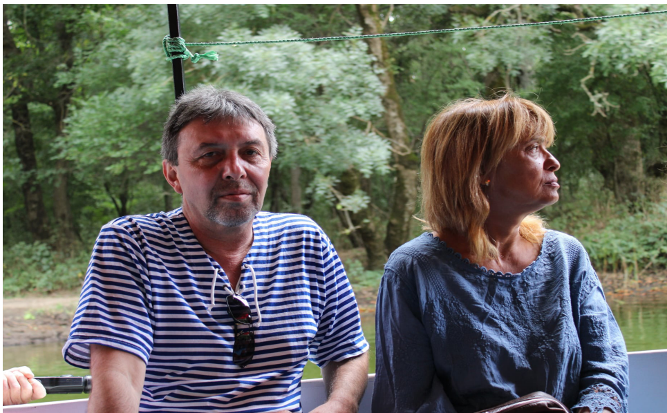
2 септември 2021 г.