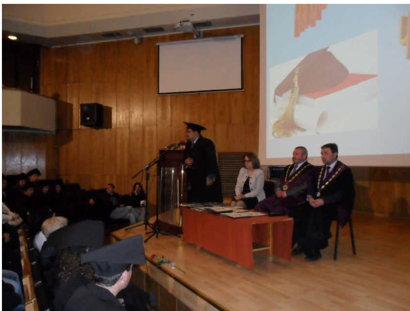
Церемония по завършването на випуск 2012 Аулата на ВТУ