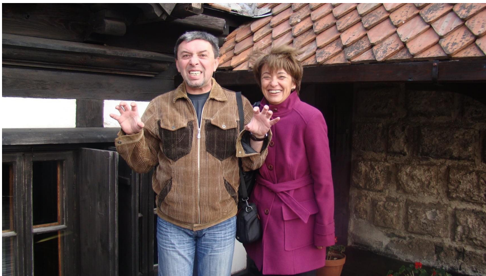
Замъкът Бран, Румъния 5 декември 2021