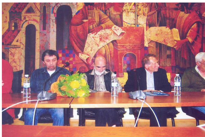
Научна конференция „България, българите и Европа“ 2008 г.