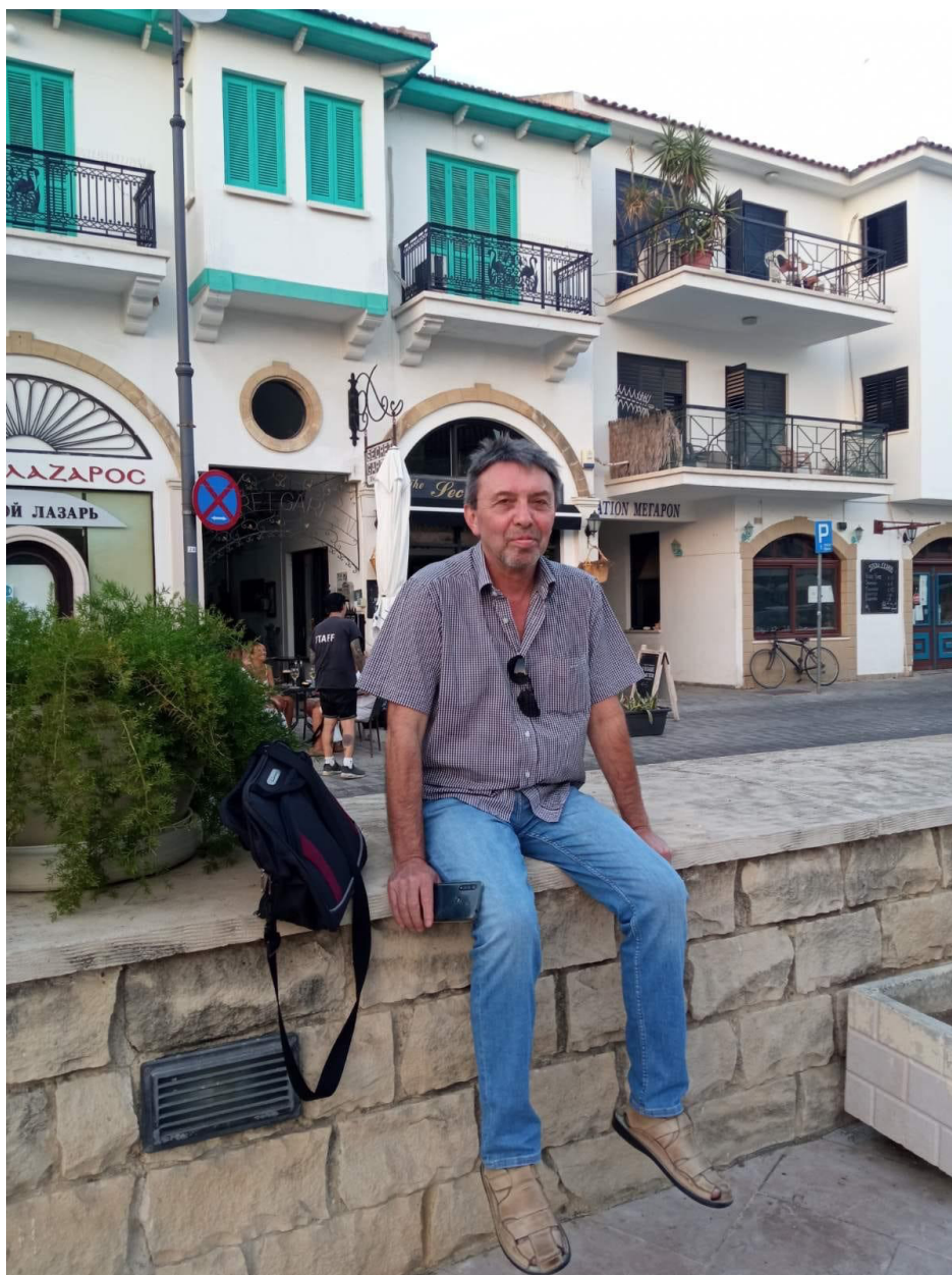
Кипър, 1 октомври 2022 г.