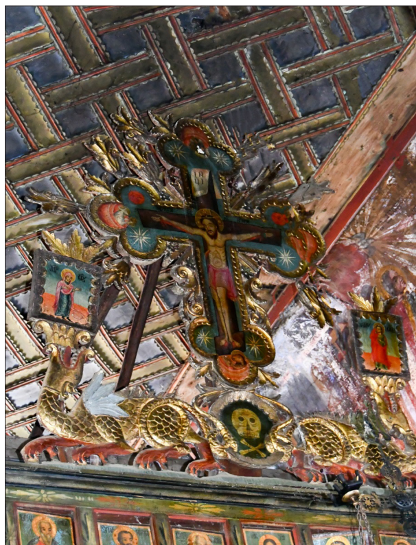
5. Венчилка на иконостас от църквата „Успение Богородично“ в с. Лъки, Гоцеделчевско

Според легендата става дума за Кръста на Разпятието като символ на космическото дърво в няколко негови превъплъщения. На първо място, старото езическо космическо дърво със змията змей, обвита около него, представено в християнския текст, е изсъхнало. При третия поглед на Сет в клоните на дървото вече е роден младият християнски Бог – Спасителят на човечеството, което като типология се свързва с космическото дърво като обиталище на бога от езическите религии на народите от Древния изток и Източното Средиземноморие. Дървесните корени пък стигат до ада. По този начин дървото определя триделността на космическото пространство по вертикалата (Иванов, Топоров 1974).