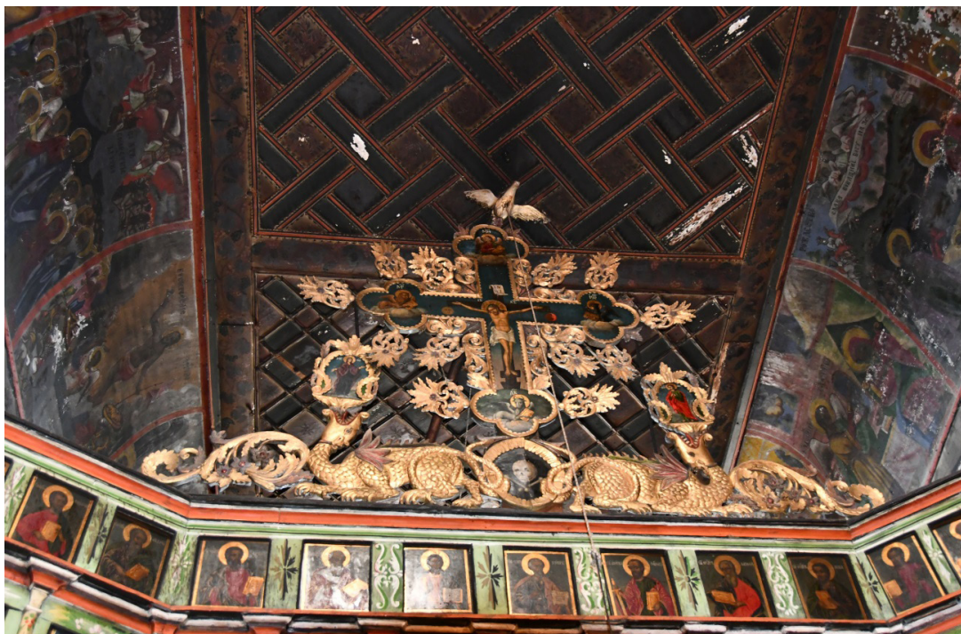
4. Венчилка на иконостаса на църквата „Св. Димитър“ в с. Тешово, Гоцеделчевско

Според легендата става дума за Кръста на Разпятието като символ на космическото дърво в няколко негови превъплъщения. На първо място, старото езическо космическо дърво със змията змей, обвита около него, представено в християнския текст, е изсъхнало. При третия поглед на Сет в клоните на дървото вече е роден младият християнски Бог – Спасителят на човечеството, което като типология се свързва с космическото дърво като обиталище на бога от езическите религии на народите от Древния изток и Източното Средиземноморие. Дървесните корени пък стигат до ада. По този начин дървото определя триделността на космическото пространство по вертикалата (Иванов, Топоров 1974).