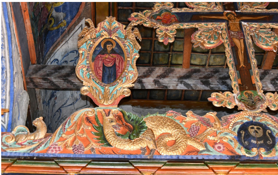
3. Венчилка на иконостаса на църквата „Св. Илия“ в с. Градево, община Симитли. Детайл

Като пазител на земята, ниви и на плодородието като цяло според българските народни вявания на змея често се налага да воюва с чуждоземни змейове, които нахлуват в селските земята и искат да оберат, да ограбят плодородието (Георгиева 1983: 79–109). В тази връзка змеят, според народните представи, притежава оръжия – той хвърля огнени стрели – светкавици и гръмотевици с които се бори с чуждите змейове. Едно от най-силните му оръжия е неговата опашка (Марков 2005: 105–166). Точно върху нея при много от изображенията на змея от венчилките на иконостасите в изследвания регион, като например тези в църквите „Св. Илия“ в с. Градево (обр. 3.), „Св. Архангел Михаил“ в с. Лъки, „Св. Димитър“ в с. Палат, е изобразен връх на стрела или копие.