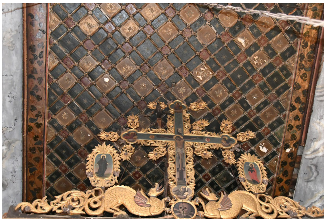
2. Венчилка на иконостаса на църквата „Св. Никола“ в с. Гайтаниново, Гоцеделчевско

Във всички останали случаи ламите от венчилките на изследваните иконостаси са разположени с главите навън, което в семантичен план по-скоро ги свързва с народната представа за змея като пазител на сакралното пространство такъв, какъвто го познаваме от древните езически култури на Източното Средиземноморие – пазител, покровител и стопанин. Такъв е той и в българската народна митология – пази земята, синори, ниви и плодородието изобщо. С тази му