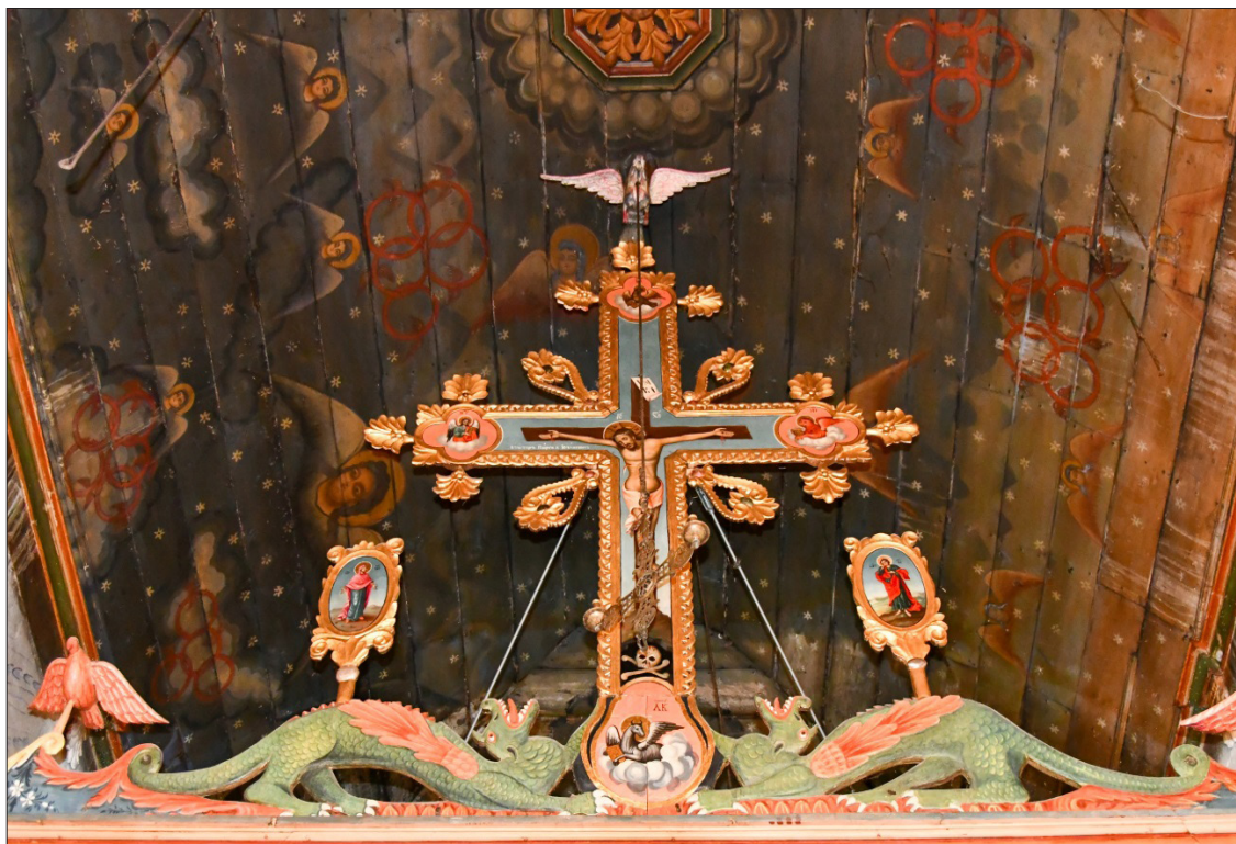
За. Венчилка на иконостаса на църквата „Успение Богородично“ в с. Огняново, Гоцеделчевско.

Специално внимание заслужава изобразяването на Кръста с Разпятието от венчилките на иконостасите обраснал с растителни мотиви – акантусови листа и цветове, а в неговата основа обикновено е нарисуван черепът от гроба на праотеца Адам.