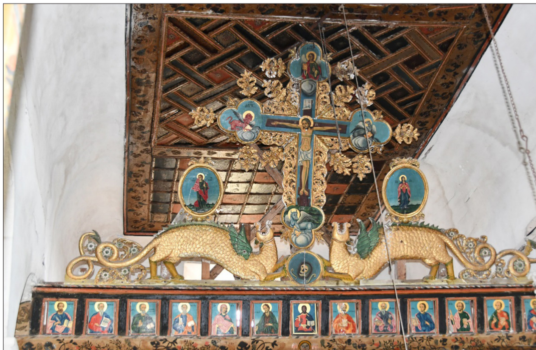
1. Венчилка на иконостаса на църквата „Св. Димитър“, с Осиково, Гоцеделчевско